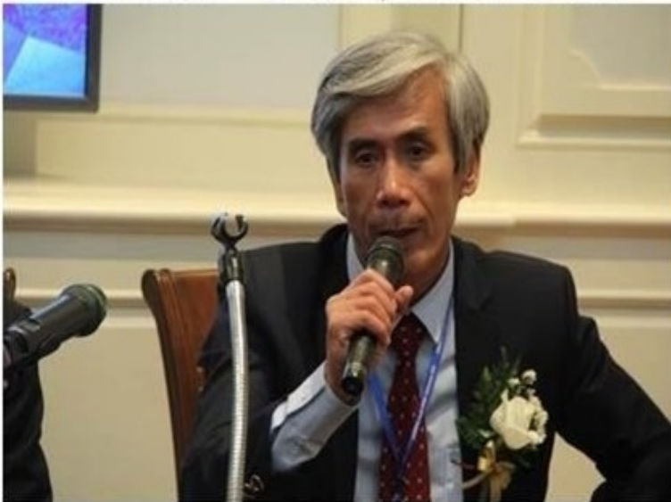
ศุภพงษ์หมด

ข่าวทั่วไป ThaiPR.net -- อังคารที่ 9 ตุลาคม 2561 15:27:07 น.