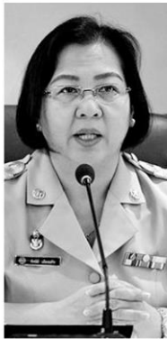
ทัศนีย์ เมืองแก้ว

ส่งเสริมสหกรณ์เปิดเผยว่า ขณะนี้กรมมีโครงการสนับสนุนให้สหกรณ์การเกษตรผลิตปุ๋ยใช้เองจำหน่ายให้กับสมาชิกและเกษตรกรทั่วไปในแต่ละพื้นที่ เพื่อช่วยลดต้นทุนการผลิตให้แก่เกษตรกร โดย