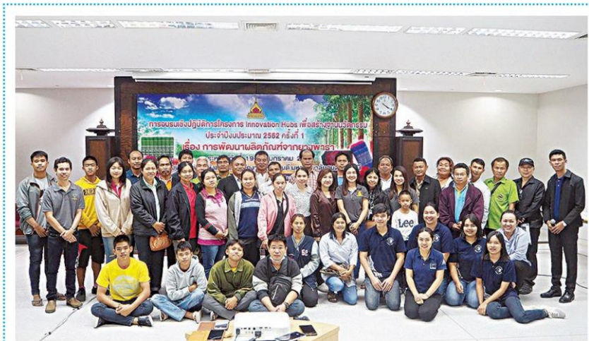
☑ อบรม... สำนักงานส่งเสริมบริหารงานวิจัย บริการวิชาการและทำนุบำรุงศิลปวัฒนธรรม มหาวิทยาลัยอุบลราชธานี จัดกิจกรรมอบรมเรื่องอบรมเชิงปฏิบัติการหัวข้อ การพัฒนาผลิตภัณฑ์จากยางพารา โดยมีเกษตรกรและผู้ประกอบการที่เกี่ยวข้องยางพารา เข้าร่วมกว่า 70 คน ณ ห้องประชุมพิบูลย์มิ่งสาหาร สำนักงานอธิการบดี มหาวิทยาลัยอุบลราชธานี เมื่อเร็ว ๆ นี้