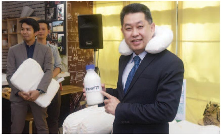
นวัตกรรมน้ำยาง ParaFIT ช่วยผู้ประกอบการลดต้นทุนในการผลิตหมอนและที่นอนยางพารา