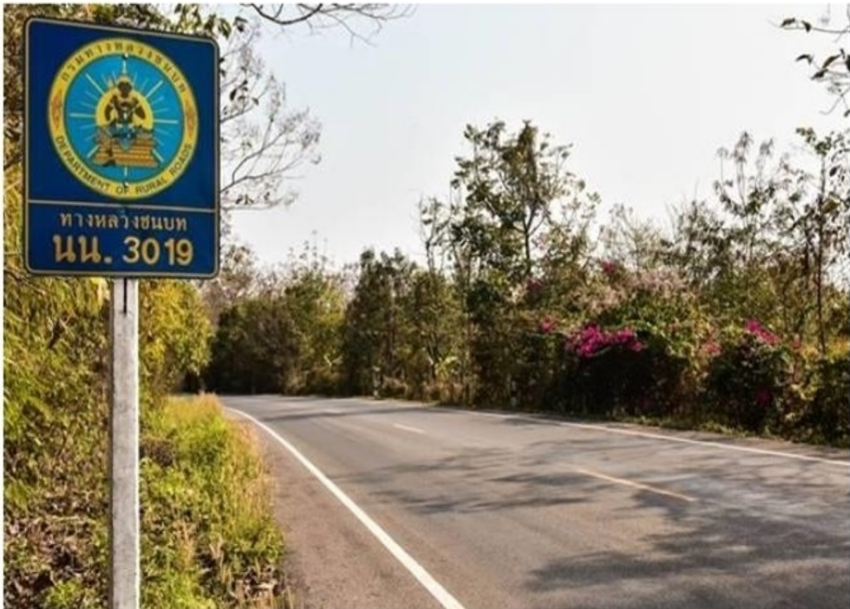
ทางหลวงชนบทถนนใช้ยางพาราซ่อมถนนช่วยชาวสวนยาง

Like 112K people like this. Sign Up to see what your friends like.