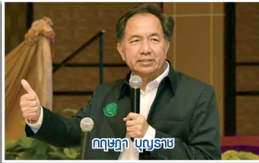
นายกฤษฎา บุญราช

นายกฤษฎา บุญราช รัฐมนตรีว่าการกระทรวงเกษตรและสหกรณ์ กล่าว ว่า ประกาศกระทรวงเกษตรฯ 5 ฉบับ เกี่ยวกับการจำกัดการใช้สารเคมี 3 ชนิด ได้แก่ พาราควอต ไกลโฟเซต และคลอร์ไพริฟอสประกาศในราชกิจจานุเบกษาแล้ว ตั้งแต่วันที่ 23 เมษายน 2562 ซึ่งจะมีผลบังคับใช้ในอีก 180 วันหลังวันประกาศ แต่กระทรวงเกษตรฯ ได้ดำเนินการแผนปฏิบัติการจำกัดการใช้สารเคมีทั้ง 3 ชนิด ตามที่กรมวิชาการจัดทำ 6 มาตรการและ คณะกรรมการวัตถุอันตรายมีมติเห็นชอบ ใน 6 มาตรการมาก่อนแล้ว ซึ่งได้รับ รายงานว่าตั้งแต่วันที่ 24 เมษายนได้เริ่ม อบรมวิทยากรซึ่งเป็นเจ้าหน้าที่ในส่วน ภูมิภาคของกรมวิชาการเกษตร 240 คน จากนั้นวันที่ 25 เมษายนอบรมเจ้าหน้าที่ จากกรมส่งเสริมการเกษตร การยางแห่งประเทศไทย สำนักงานคณะกรรมการอ้อย และน้ำตาลแห่งประเทศไทย 2,000 คน เพื่อสร้างวิทยากรไปให้ความรู้แก่เกษตรกร 1,500,000 คน ในช่วงเดือนมิถุนายน-กันยายน สำหรับผู้รับจ้างพ่น 50,000 คน จะจัดอบรมระหว่างเดือนมิถุนายน-