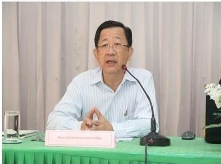
ดูรูปทั้งหมด

ข่าวเศรษฐกิจ สำนักข่าวอินโฟเควสท์ (IQ) -- พุธที่ 30 พฤษภาคม 2562 14:21:34 น.