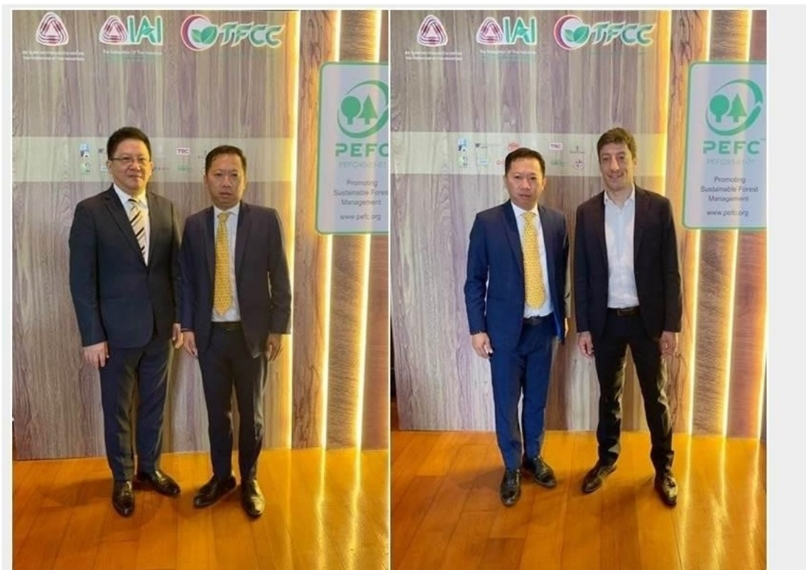
"ทาง กยท. มีบทบาทในการส่งเสริมให้เกษตรกรได้รับการรับรองมาตรฐานสากล (PEFC) โดยมีปริมาณเสถียรตาม พ.ร.บ การยางแห่งประเทศไทย พ.ศ. 2558 49 (3) เป็นค่าใช้จ่ายในการส่งเสริม สนับสนุน และให้ความช่วยเหลือเกษตรกร สถาบันเกษตรกร ชาวสวนยาง และผู้ประกอบการยาง กำหนดเป้าหมายนำร่องพื้นที่สวนยาง จำนวน 200,000 ไร่ ใน 7 จังหวัดภาคใต้ ได้แก่ จ. นครศรีธรรมราช จ. สุราษฎร์ธานี จ. สงขลา จ. กระบี่ จ. ตรัง จ. พัทลุง และ จ. สตูล เนื่องจากเป็นพื้นที่ซึ่งมีสวนยางหนาแน่น รวมถึงมี บริษัทรับซื้อน้ำยางและไม้ยางพาราในพื้นที่จำนวนมาก โดยหลังจากนี้จะมีการขยายพื้นที่สวนยางเป้าหมายให้ได้รับมาตรฐานสากล ทั่วประเทศ" รองผู้ว่าการ กยท. กล่าวทิ้งท้าย

หัวข้อข่าว: กยท.-สภาอุตสาหกรรมร่วมมือยกระดับสวนยางสู่มาตรฐานสากล