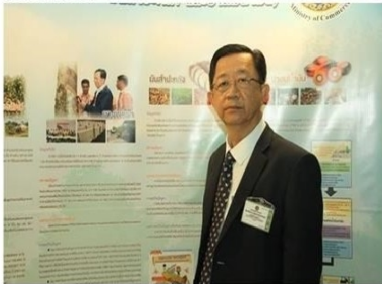
ดูรูปทั้งหมด

ข่าวเศรษฐกิจ สำนักข่าวอินโฟเควสท์ (IQ) -- พุธที่ 4 กรกฎาคม 2562 14:15:18 น.