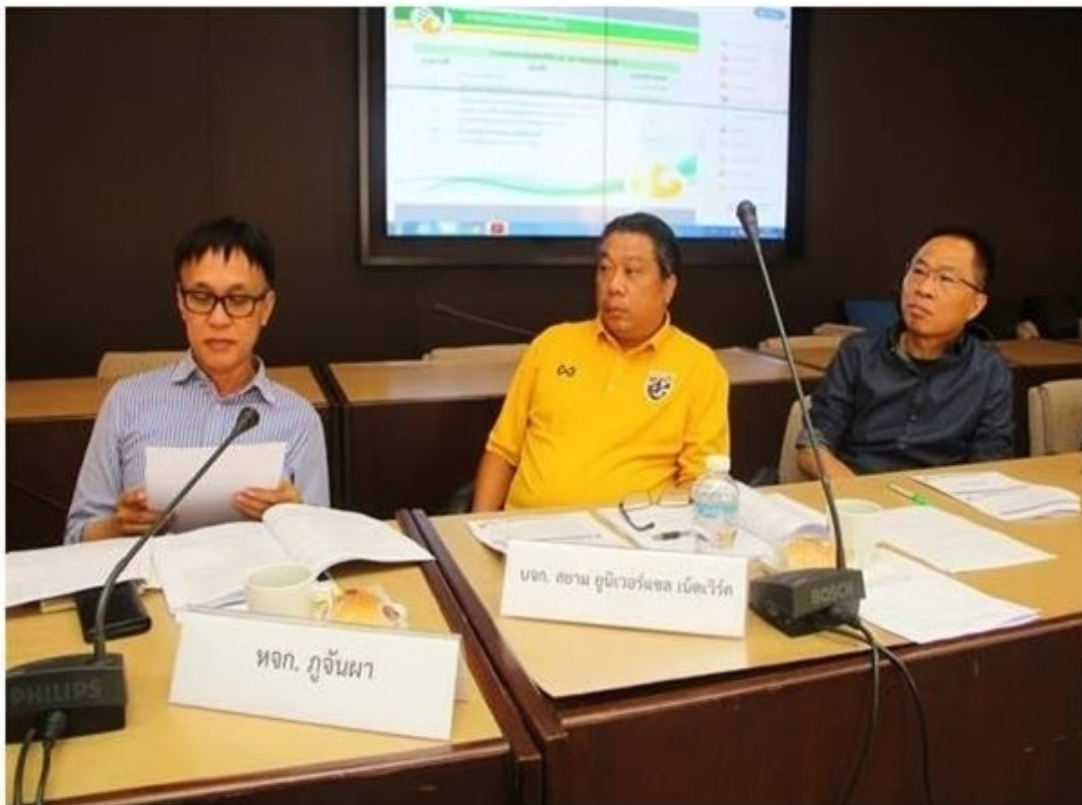
กรุงเทพฯ-4 ก.ค.-การยางแห่งประเทศไทย