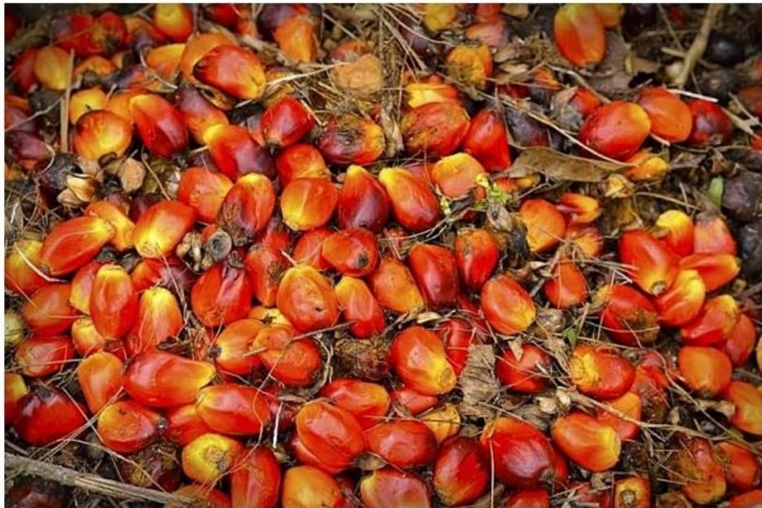
ที่มา ฐานเศรษฐกิจ

หัวข้อข่าว: ฐานเศรษฐกิจ | บิ๊ก กยท.-กรมส่งเสริมการเกษตร เร่งจ่ายเงินชาวสวนปาล์ม-ยาง คืบ 97%