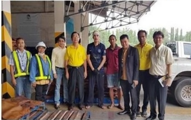
ดูรูปทั้งหมด

ข่าวทั่วไป ThaiPR.net -- ศุกร์ที่ 5 กรกฎาคม 2562 15:35:23 น.