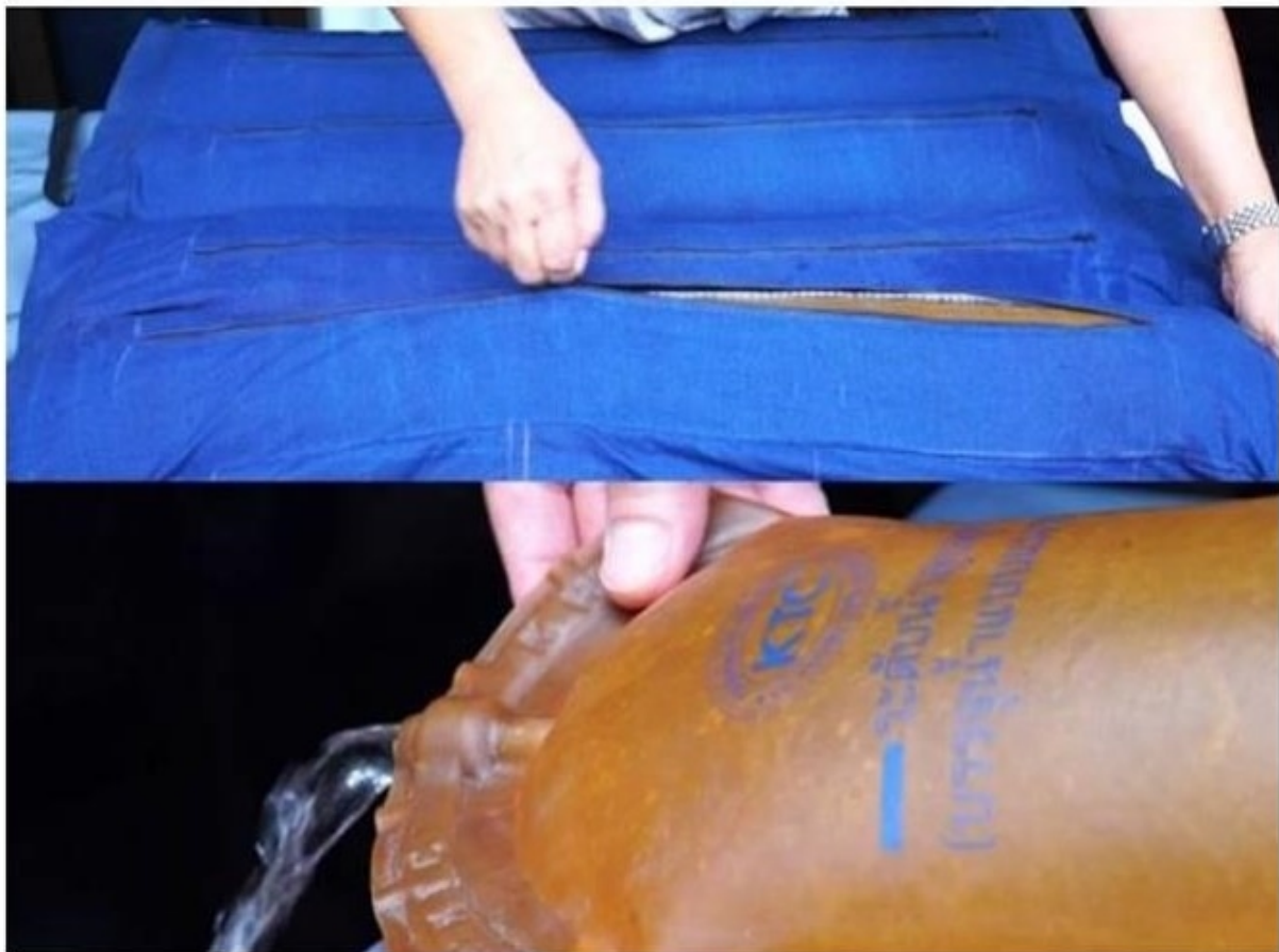
“ที่นอนน้ำเพื่อสุขภาพ” ผลิตจากยางพารา เพื่อผู้ป่วย

👍 Like 114K people like this. Sign Up to see what your friends like.