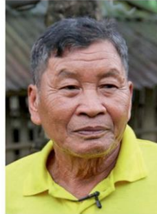
พันธุ์ ยามดี