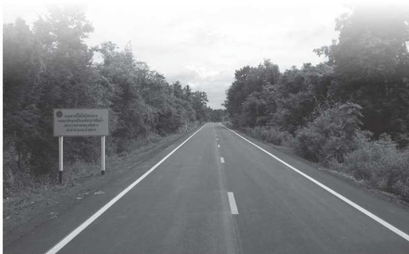
นบ. นำร่องใช้ยางพาราเป็นส่วนผสมก่อสร้างถนน สาย uw.4026 จ.นครพนม เพื่อทดสอบความคงทนของคืนทางต่อสภาวะอุทกภัย

สำหรับนโยบายเพิ่มปริมาณยางพาราครั้งนี้ ผลพวงสำคัญ นอกจากคนไทยทั้ง