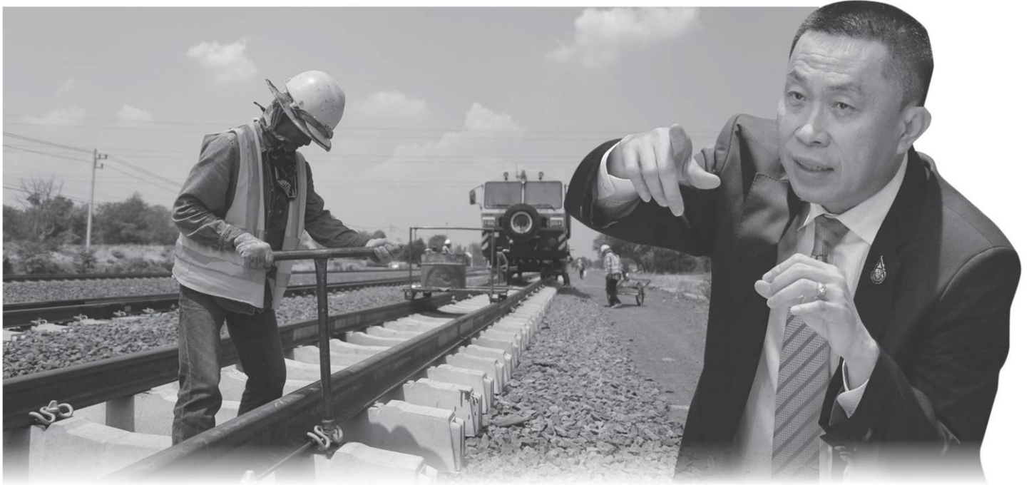
นายกิตติสยาม ชาติชอบ รัฐมนตรีว่าการกระทรวงคมนาคม

หัวข้อข่าว: นโยบายเสริมแกร่ง "Thai First" ไทยทำ ไทยใช้ คนไทยต้องได้ก่อน