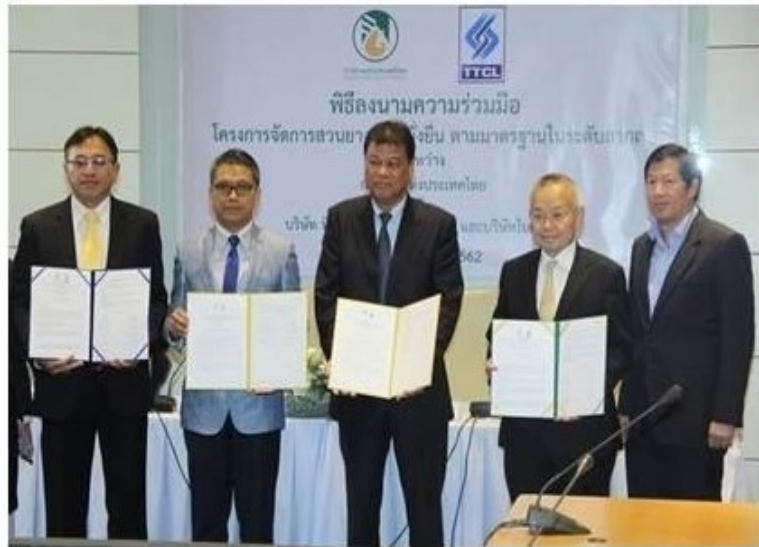
ดูรูปทั้งหมด

ข่าวเศรษฐกิจ ThaiPR.net -- พฤหัสบดีที่ 3 ตุลาคม 2562 15:01:29 U.