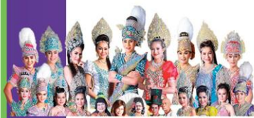
ประจิมบันเทิงศิลป์ 17 ธ.ค.