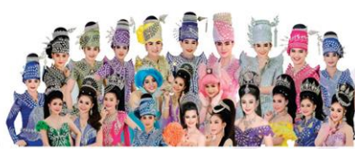
ระเบียบวาทะศิลป์ 18 ธ.ค.