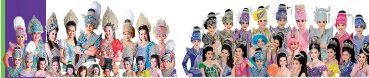
ประถมนันทศิลป์ 17 ธ.ค.