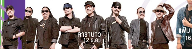
คาราบาว 12 ธ.ค.