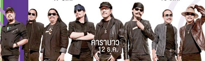
คาราบาว 12 ธ.ค.