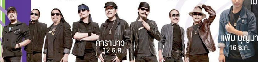
คาราบาว 12 ธ.ค.