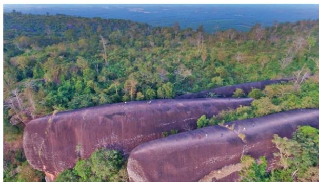
หินสามวาฬ แหล่งท่องเที่ยวธรรมชาติชื่อดังของจังหวัด

หัวข้อข่าว: งานวันยางพาราบึงกาฬ จัดส่งท้ายปีโซวีโมเดล2020