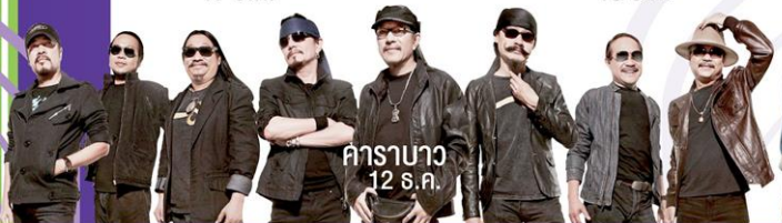
คาราบาว 12 ธ.ค.