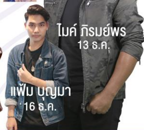
ไพบุญญา 16 ธ.ค.