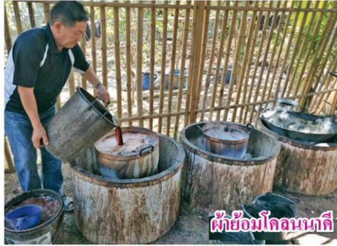
ค้าข้อมโกลนนาถิ สินค้าขึ้นชื่อบึงกาฬ

สำหรับเกษตรกรด้านอื่นๆ บรรจุไว้ในแผนพัฒนาจังหวัด ปี 2561-2565 ส่งเสริมและพัฒนาภาคการผลิตสินค้าเกษตร