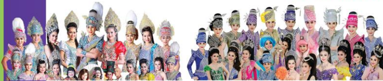
ประตมบันเทิงศิลป์ 17 ธ.ค.