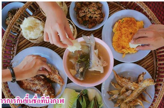
อาหารการกินขึ้นชื่อที่บึงกาฬ