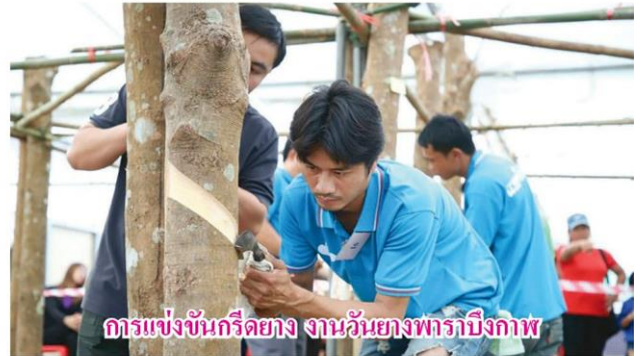
การแข่งขันกรีดยาง งานวันยางพาราบึงกาฬ

ปลอดภัยและเกษตรกรอินทรีย์เพื่อเพิ่มมูลค่า เพื่อให้เกษตรกรผลิตสินค้าและผลิตภัณฑ์ด้านการเกษตรให้มีคุณภาพดีเป็นที่ต้องการของตลาดและมีราคาสูง