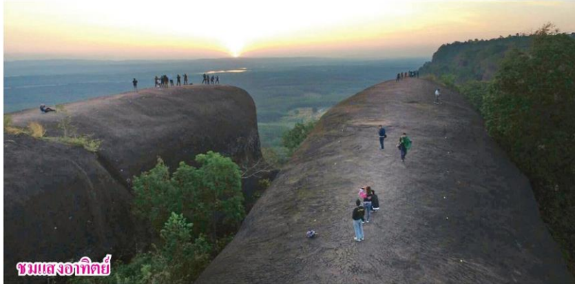
ชมแสงอาทิตย์

หัวข้อข่าว: ไปงานยางพาราบึงกาฬ แนะนำเที่ยวชม 'หินสามวาฬ'