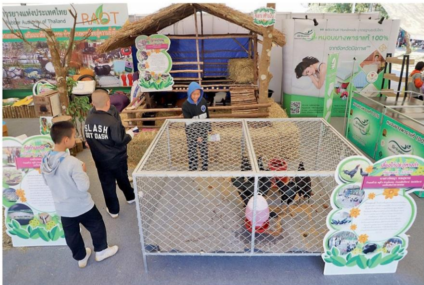
กยท.ออกบูธให้ความรู้เรื่องการเลี้ยงสัตว์ควบคู่กับการทำสวนยางพารา ภายในงานวันยางพาราบึงกาฬ 2563

ผสมผสาน ปลูกป่ายาง ทำระเบียบข้อบังคับให้แน่นกว่านี้ รับรองว่าจะสร้างมาตรฐานรับรองมาอีกก็อย่างเราก็สู้ได้หมด”