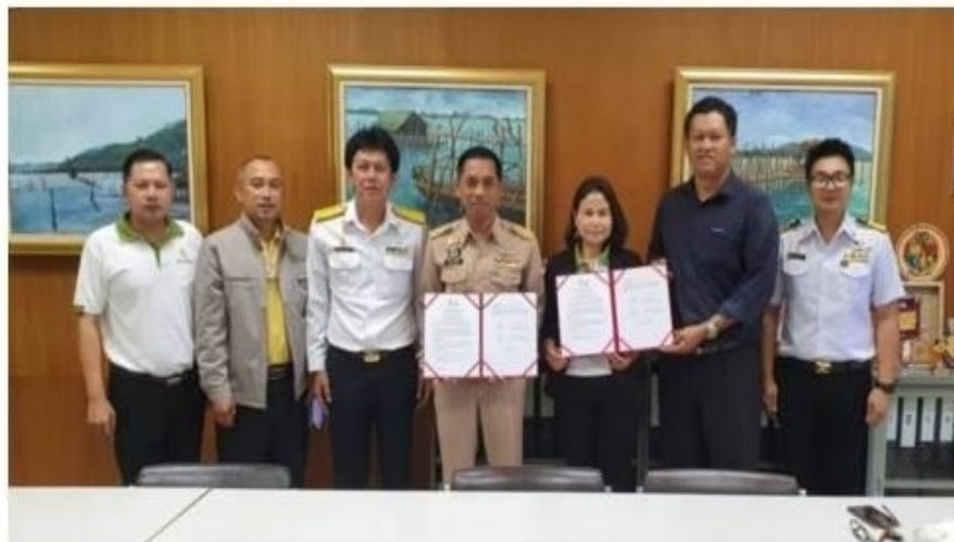
ขอบคุณภาพข่าว: การยางแห่งประเทศไทยเขตภาคใต้ตอนล่าง

โดยการมีส่วนร่วมของเกษตรกรชาวสวนยาง เพื่อเพิ่มมูลค่าผลผลิตยางพาราทุกประเภท ทั้งไม้ยางพารา น้ำยางสด ยางแผ่นดิบ ยางแผ่นรมควัน และอื่น ๆ และเพื่อเป็นการพัฒนาอุตสาหกรรมยางพารา โดยคำนึงถึงการอนุรักษ์ฟื้นฟูทรัพยากรธรรมชาติและสิ่งแวดล้อม สำหรับเป้าหมาย ในการดำเนินการร่วมกันในปี 2563 กยท. ช.ดล. กำหนดเป้าหมายการดำเนินงาน FSC ทั้งประเภท FM และ CoC รวมทั้งสิ้น 38,000 ไร่