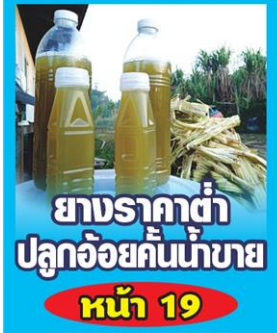
ยางราคาต่ำ ปลูกอ้อยคั้นน้ำขาย หน้า 19