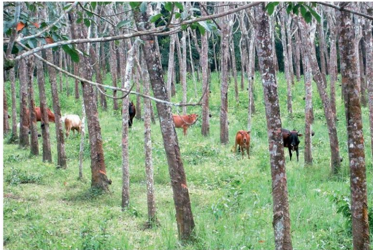
เลี้ยงโคในสวนยาง หนึ่งในทางรอดของเกษตรกรชาวสวนยางภาคใต้

เศรษฐกิจอย่างยั่งยืน หรือ มอก.14061 ซึ่งครอบคลุมทั้งหมดก็โอเคแล้ว