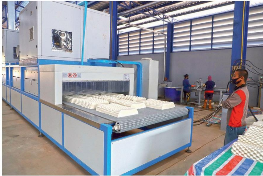
“หมอนยางพารา” นวัตกรรมแปรรูปเพิ่มมูลค่า โดยชุมชนสหกรณ์ชาวสวนยาง จังหวัดบึงกาฬ

หน้า: 13(เต็มหน้า) หน้า: 13(เต็มหน้า) PRValue (x3): 1,053,969 คลิป: สีสี่