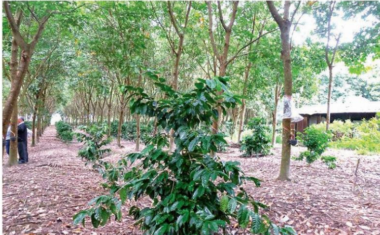
เกษตรกรผสมผสานโดย "สมจิตร บรรณจักร์" เกษตรกรชาวเชียงใหม่ มีแนวคิดปลูกกาแฟสายพันธุ์อาราบิก้าใต้ต้นยางพารา พร้อมเลี้ยงสัตว์และพืชอื่นๆควบคู่กับการทำสวนยาง

หัวข้อข่าว: 'สวนยางยั่งยืน' ทางรอดเกษตรกรไทย ในสถานการณ์'กลไกตลาด'ผันผวน