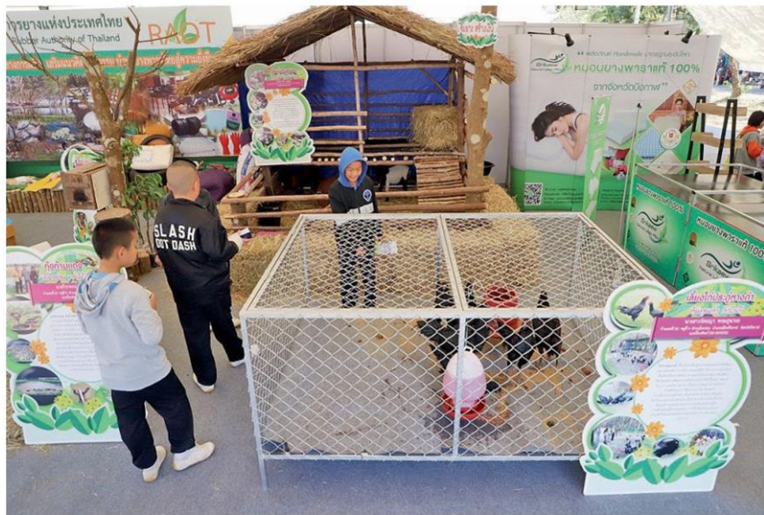
กยท.ออกบูธให้ความรู้เรื่องการเลี้ยงสัตว์ควบคู่กับการทำสวนยางพารา ภายในงานวันยางพาราบึงกาฬ 2563

ผสมผสาน ปลูกป่ายาง ทำระเบียบข้อบังคับให้แน่นกว่านี้ รับรองว่าจะสร้างมาตรฐานรับรองมาอีกก็อย่างเราก็สู้ได้หมด”