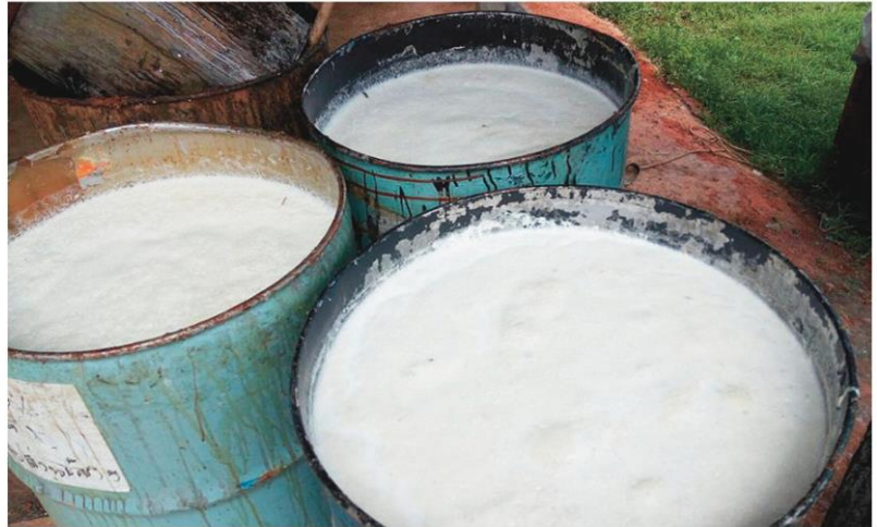
ยางสด - การแพร่ระบาดของโรคโควิด-19 ทำให้โรงงานผลิตถุงมือแพทย์มีความต้องการน้ำยางสด เพื่อไปผลิตถุงมือปริมาณมาก แต่ปัจจุบันผลผลิตไม่เพียงพอ

“ตอนนี้ความต้องการน้ำยางสดเพื่อนำไปแปรรูปเป็นน้ำยางชั้นมีมาก ขนาดโรงงานอุตสาหกรรมที่แปรรูปเป็นผลิตภัณฑ์ถุงมือยาง เคยหยุดกิจการก็กลับมาสามารถฟื้นฟูได้อีก ในขณะนี้ แต่ตอนนี้ยางพาราอยู่ในฤดูกาลผลิตใบปิด