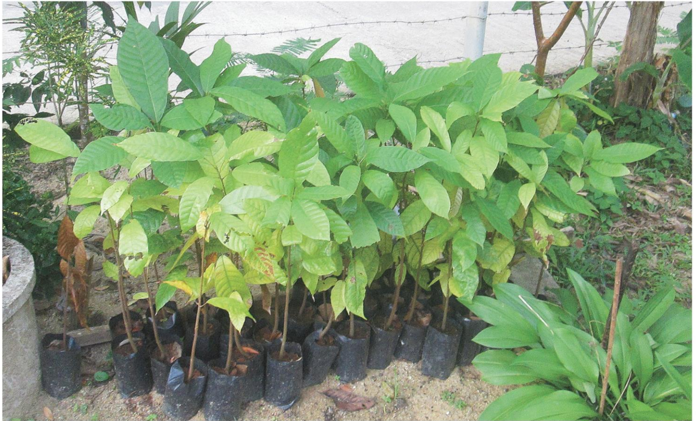
ต้นกล้าโกโก้ - บริษัทขายต้นกล้าโกโก้จำนวนมากต่างเลือกพื้นที่ภาคใต้ในการส่งเสริมการปลูกโกโก้ นับตั้งแต่ช่วงปลายปี 2562 ถึงปัจจุบัน โดยเฉพาะจังหวัดพัทลุง นครศรีธรรมราช และสุราษฎร์ธานี ซึ่งสร้างความกังวลให้หน่วยงานเกษตรและสหกรณ์ในพื้นที่เป็นอย่างมาก เพราะเกรงว่าจะถูกหลอกเหมือนเมื่อกว่า 30 ปีก่อนที่ไม่มีตลาดรองรับ

หัวข้อข่าว: พ่อค้าพันธุ์โกโก้แหล่งใต้เรขายต้นกล้า เครื่องขายสวนยางหัวนั้ร่ายยถูกหลอกไร่ตลาด..