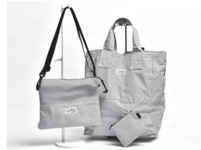
กระเป๋าเลือกกันฝน

สำหรับผู้ที่รักสวยรักงามต้องการดูแลผิวแบบออร์แกนิก Ecotopia ยังมีผลิตภัณฑ์ที่ปลอดภัยและมีประสิทธิภาพ “เครื่องสำอางสำหรับเด็ก” แบรนด์แพร์รี่สตา มีส่วนผสมหลักจากธรรมชาติ ปราศจากสารเคมีอันตราย 100% อ่อนโยนต่อผิวของน้องๆ สดชื่นนาน, “ฟอร์เรสลิปสติค” ส่วนผสมธรรมชาติ 100% เช่น น้ำมันมะพร้าวช่วยบำรุงริมฝีปาก สีสวยติดทนนาน ด้วยผงสีจากสารสกัดผักและผลไม้พร้อมฟีนูริมฟีนูริคสกัดกลับมาสดใสด้วยสารสกัดมะขามป้อม สารสกัดเปลือกมังคุด มีกลิ่นหอมอ่อนๆ ของผลไม้ มีสีให้เลือกหลากหลาย นอกจากนี้ยังมีสินค้าแฟชั่นที่มาในรูปแบบรีไซเคิล และอัพไซเคิล ด้วยการเอาวัสดุเหลือใช้ มาสร้างเป็นผลิตภัณฑ์ใหม่ อาทิ