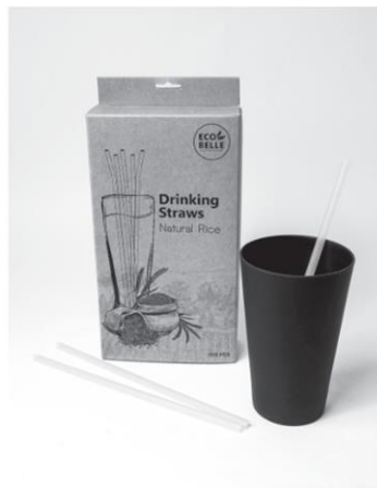
หลอดรักษ์โลกผลิตจากข้าว

จากความเชื่อที่ว่า “เราสร้างโลกให้ดีขึ้นได้ด้วยกัน” Ecotopia (อีโคโทเปีย) เมืองแห่งคนรักษ์โลก ศูนย์รวมผลิตภัณฑ์เพื่อสุขภาพที่มีตั้งแต่ของใช้ประจำวัน รวมไปถึงผลิตภัณฑ์ที่เป็นมิตรต่อสิ่งแวดล้อม ปลอดภัย และหลากหลาย อีกทั้งยังเป็นการช่วยชุมชน เสริมสร้างการใช้ทรัพยากรได้อย่างคุ้มค่าตอบโจทย์วิถีการใช้ชีวิตในยุคปัจจุบัน เปิดให้ทุกคนเข้ามาค้นพบและเลือกสรรได้ที่อีโคโทเปียได้อย่างครบครัน จบได้ในที่เดียวกว่า 300 แบรนด์ที่ Ecotopia ชั้น 3 สยามดิสคัฟเวอรี ซึ่งเราสามารถฉลาดเลือก ฉลาดใช้ สิ่งของในชีวิตประจำวันที่จะช่วยลด และรักษาโลกของเราให้คงอยู่อย่างยั่งยืนได้อย่างไรจากสิ่งของเครื่องใช้ที่ดูเหมือนธรรมดาแต่ไม่ธรรมดา เริ่มตั้งแต่ผลิตภัณฑ์สำหรับใช้ในชีวิตประจำวัน อย่าง “กระบอกน้ำและแก้วน้ำผลิตจากไม้ไผ่” แบรนด์ Bambooyst สินค้าเป็นมิตรกับสิ่งแวดล้อม ปลอดภัย ถูกลงไปไหนก็สร้างเอกลักษณ์, “หลอดรักษ์โลก” แบรนด์ Ecobelle ทำจากต้นข้าวธรรมชาติ สามารถใช้ได้นานถึง 2 ชั่วโมง สามารถย่อยสลายเองประมาณ 6 เดือน ถึง 1 ปี อีกทั้งช่วยเพิ่มรายได้ให้กับเกษตรกรอีกด้วย “แปรงสีฟันไม้ไผ่” จากแบรนด์ environman สามารถ