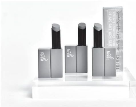
ฟอร์เรสลิปสติค

คอลัมน์: Be Trend: Ecotopia ชวนซื้อผลิตภัณฑ์รักษ์โลก รักสุขภาพ