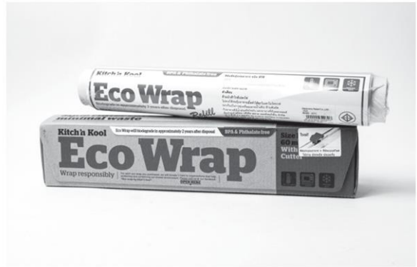
ฟิล์มถนอมอาหารอีโค