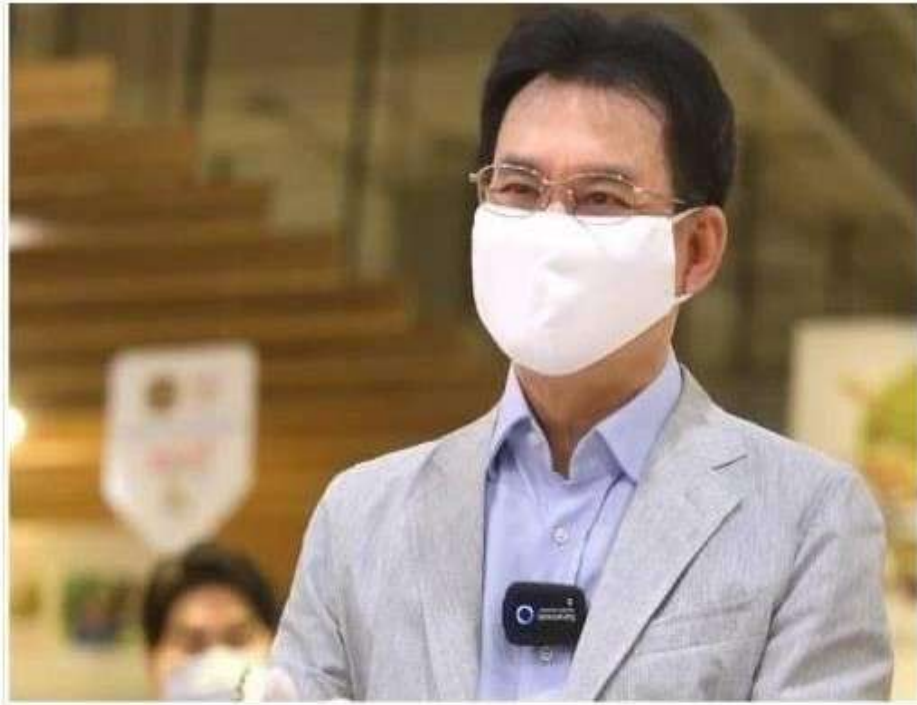
พล.อ.ประยุทธ์ จันทร์โอชา นายอนุทิน ชาญวีรกูล นายจรินทร์ ลักษณวิศิษฏ์

หัวข้อข่าว: ทูมประกันราคา "ข้าว-ยาง" กระจากเรตตั้ง ชื่อใจพรครร่วม อัถฉิตบักโปรเจกต์ปลูกชีฟอันตามัน