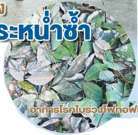
อาการโรคใบร่วงไฟทอพรอรา

“อย่างไรก็ตาม ภัยธรรมชาติเป็นสิ่งที่เกษตรกรหลีกเลี่ยงไม่ได้ ดังนั้นการฟื้นฟูสวนยางให้ดีขึ้นหลังจากน้ำลดจึงเป็นวิธีที่ดีที่สุด จึงขอแนะนำเกษตรกรสำรวจความเสียหายสภาพสวนยางเพื่อหาแนวทางในการฟื้นฟูและจัดการสวนยาง หลังจกถูกน้ำท่วม กรณีน้ำท่วมสวนยางเกินกว่า 30 วันเกษตรกรควรเร่งระบายน้ำออกจากสวนหากมีบริเวณรอบสวนยางมีระดับสูงกว่าไม่สามารถระบายออกได้ ให้ขุดร่องน้ำกึ่งกลางระหว่างแถวยางเพื่อให้มีน้ำระบายไปอยู่ในร่องที่ขุดไว้ โดยใช้แรงงานคนและเครื่องจักรขนาดเล็กเท่านั้น จากนั้นรอให้น้ำแห้ง