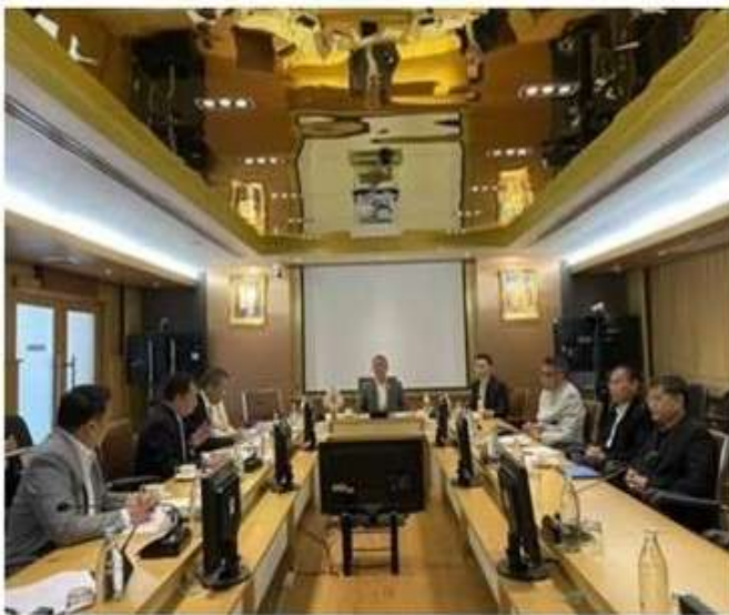
กระทรวงเกษตรฯ เรียกประชุมด่วน หลังราคายางพาราผันผวนต่อเนื่อง

กระทรวงเกษตรฯ เรียกประชุมด่วน เตรียมเคาะมาตรการช่วยเหลือเกษตรกรรถล๊อปด้าหน้า หลังราคายางพาราผันผวนต่อเนื่อง