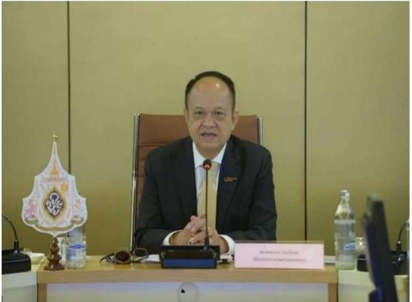
ทองเปลว กองจันทร์

หัวข้อข่าว: ราคายางพาราดีงนรก "สหกรณ์" ตายเรียบ