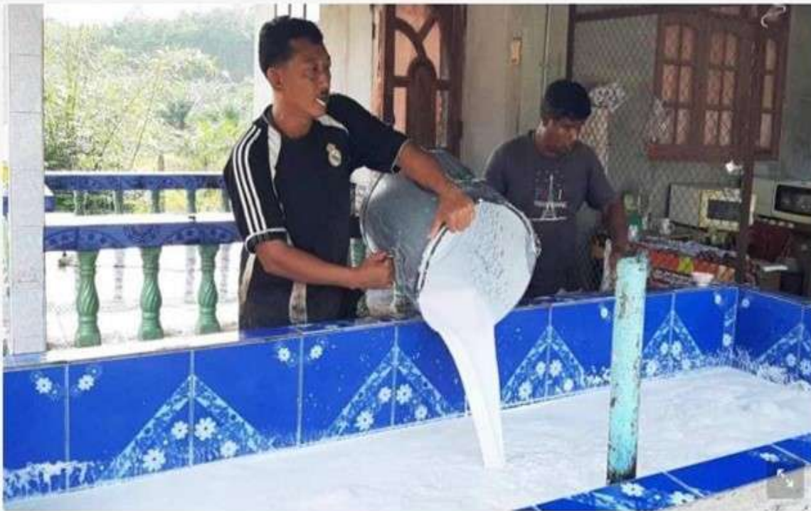
ภาพไฮไลต์

อัปเดต 15 ชั่วโมงที่ผ่านมา • เผยแพร่ 15 ชั่วโมงที่ผ่านมา