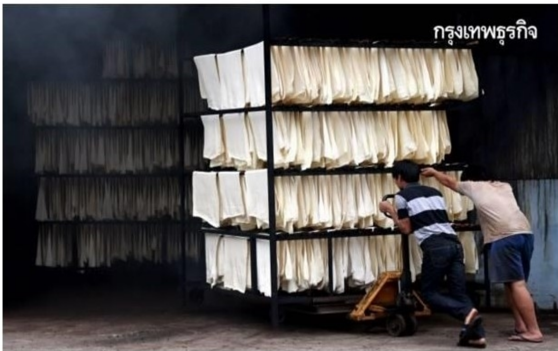
13 พฤษภาคม 2564 | โดย การยางแห่งประเทศไทย

ราคายางแผ่นรมควัน ชั้น 1 (ม.ย.) กรุงเทพฯ 75.05บาท/กก. สงขลา 74.80บาท/กก.