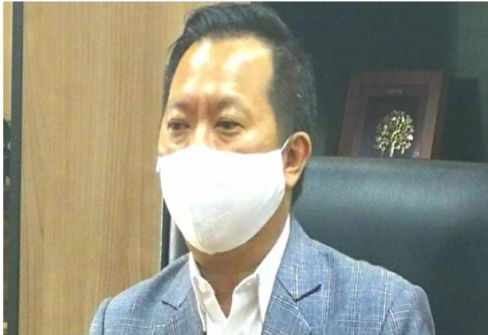
"กยท." เดินหน้าสร้างความเข้มแข็งให้ยางไทยฝ่าโควิด-19

และที่สำคัญช่วยรักษาสภาพคล่องทางการเงินให้ชาวสวนยางไม่ให้หยุดชะงัก ขณะเดียวกันยังได้มีการส่งเสริมการใช้ยางเพื่อเพิ่มปริมาณการใช้ยางในประเทศอีกด้วย ทำให้สถานการณ์ราคายางวันนี้ยังอยู่ในแนวโน้มที่ดีคือยางแผ่นรมควันราคามากกว่า 50 บาทต่อกิโลกรัม และราคายางก้อนราคาไม่ต่ำกว่า 46 บาทต่อกิโลกรัม