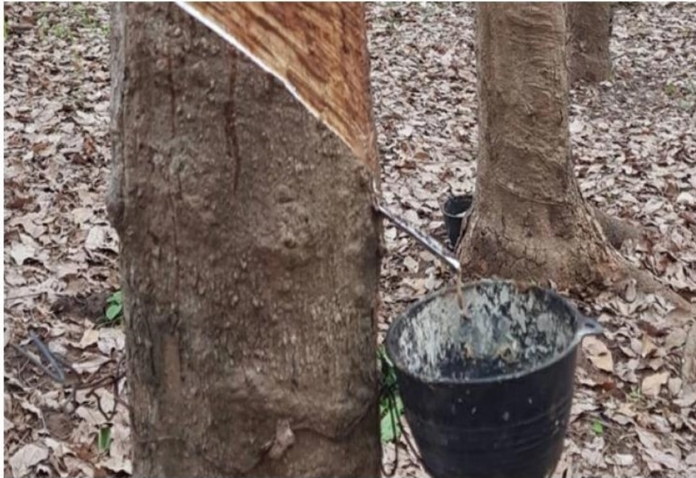
"กยท." เดินหน้าสร้างความเข้มแข็งให้ยางไทยฝ่าโควิด-19

หัวข้อข่าว: "กยท." เดินหน้าสร้างความเข้มแข็งให้ยางไทยฝ่าโควิด-19