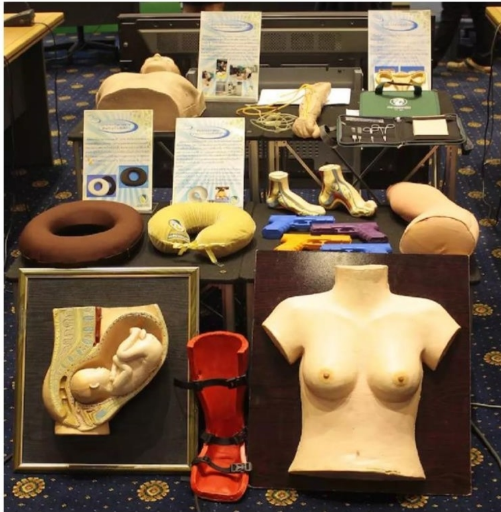
"กยท." เดินหน้าสร้างความเข้มแข็งให้ยางไทยฝ่าโควิด-19

หัวข้อข่าว: "กยท." เดินหน้าสร้างความเข้มแข็งให้ยางไทยฝ่าโควิด-19