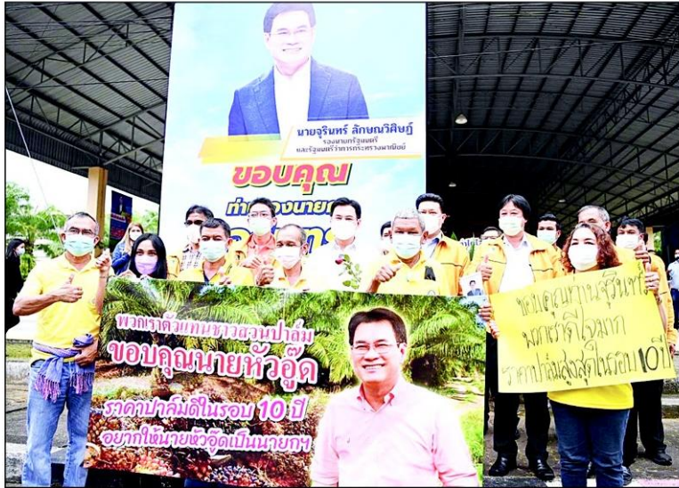
“จุรินทร์ ออนไลน์ตรง” พร้อมเดิหน้าประกัรรายได้ ปี 3 ชาวตรงลัน! “ท่านจุรินทร์ สู้ๆ” ปาล์มราคาสูงสุดในรอบ 10 ปี ยางราคาดี