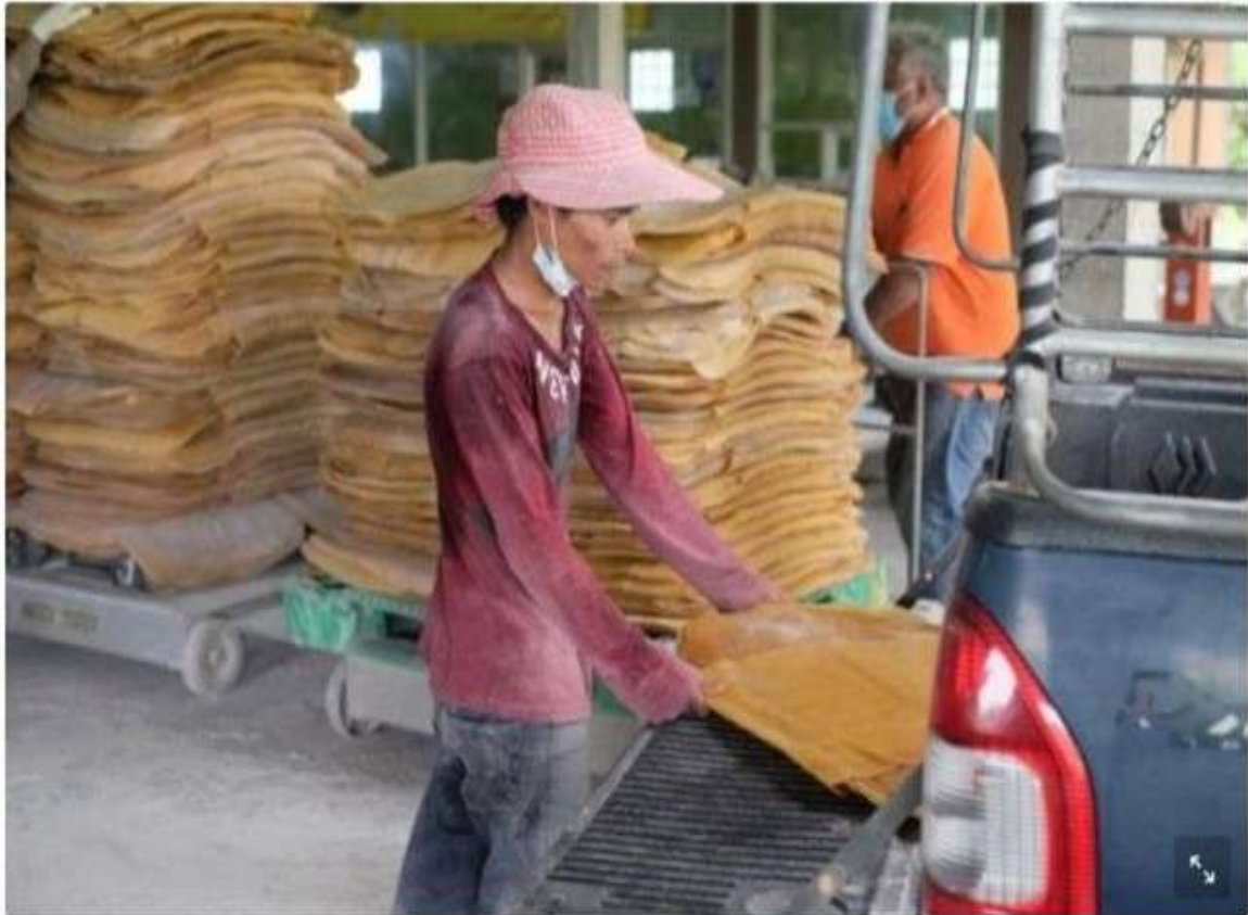
ประกันรายได้

หัวข้อข่าว: กยท.โอนเงินประกันรายได้งวด 3 ชาวสวนยางเข้าบัญชีวันนี้ | The Bangkok Insight | LINE TODAY