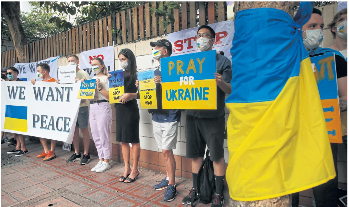
People display placards during a protest held outside the Russian embassy in Bangkok on Monday, demanding an end to the Russian invasion of Ukraine. ARNUN CHONMAHATRAKOOL

"This certainly impacts more than just Russians. Long-haul travellers from Europe or people flying in that direction may be less likely to want to travel. There are now flight disruptions from the UK to Thailand. Flights are being diverted away from Ukraine's air-space. This affects travel sentiment."