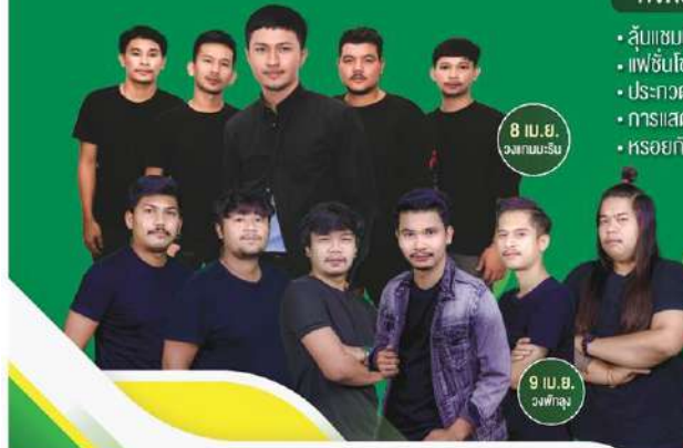
8 เม.ย. เวทีชุมชน