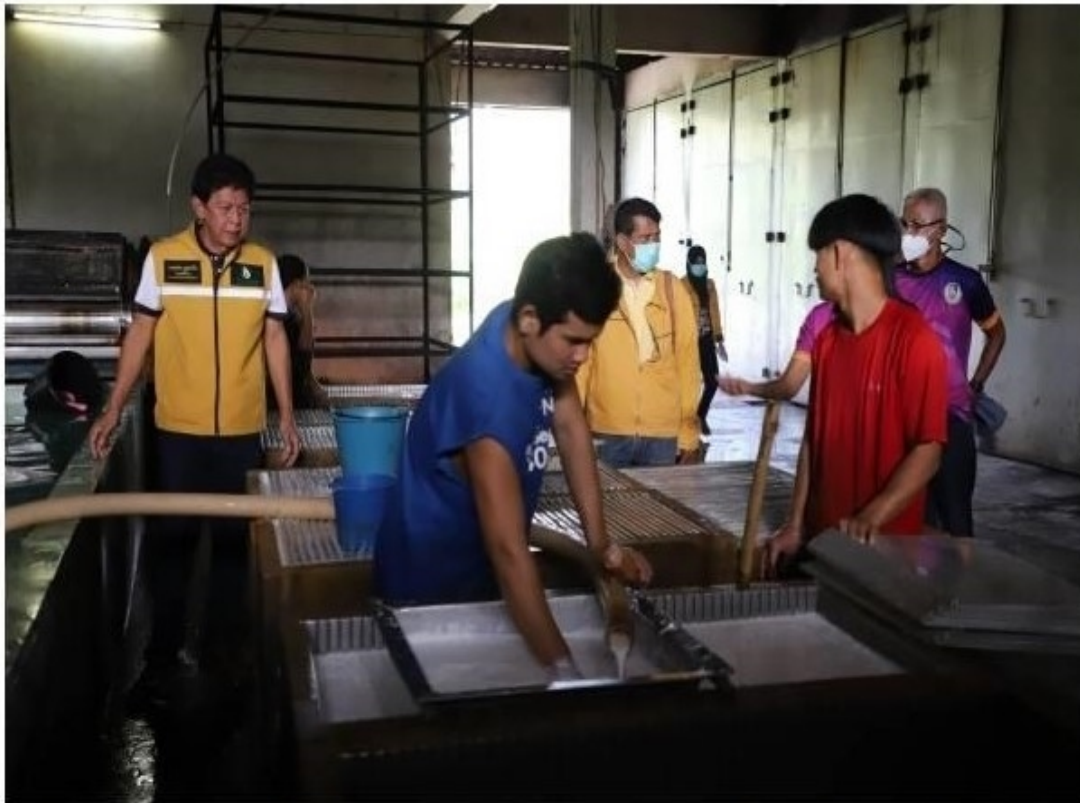
บัตตานี-ผอ.กยท.เขตภาคใต้ตอนล่าง ติดตาม โครงการชะลอยางของเกษตรกร ชาวสวนยางบัตตานี "เฮ" รายได้ดีขึ้น หลังเข้าร่วมโครงการฯ