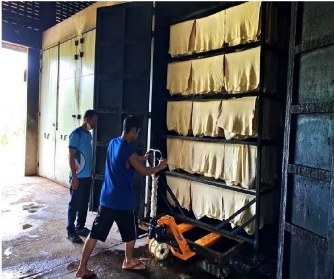
ภาพ/ข่าว/บดินทร์ ทิมขาว@ชายแดนใต้