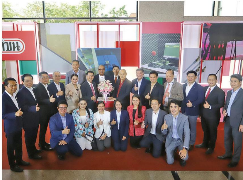
นพ.ชลดาน ศรีแก้ว ส.ส.น่าน หัวหน้าพรรคเพื่อไทย น.ส.แพทองธาร ชินวัตร หัวหน้าครอบครัวเพื่อไทย พร้อมคณะผู้บริหารพรรค ส.ส. ร่วมแสดงความยินดี

หัวข้อข่าว: 'มติชน' ก้าวสู่ปีที่ 46 บอกรุ่น อวยพรแน่นชูถูกต้องรวดเร็ว