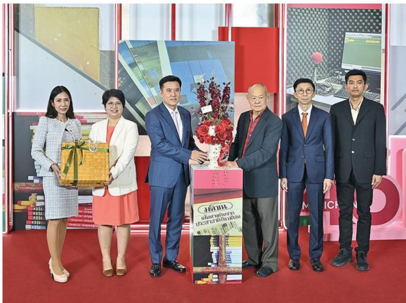
ชัยวุฒิ ธนาคมานุสรณ์ รัฐมนตรีว่าการกระทรวงดิจิทัลเพื่อเศรษฐกิจและสังคม ร่วมอวยพร