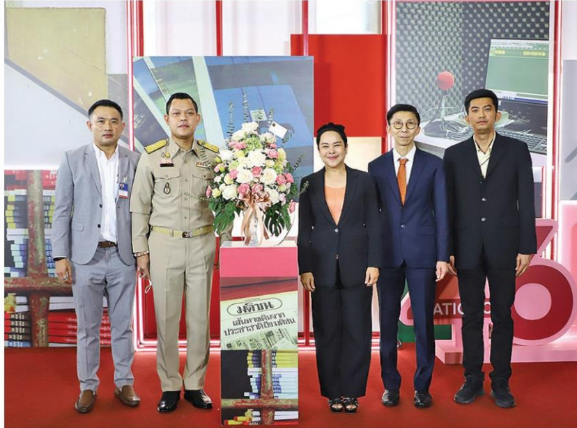
ชนกร วัจนุกองชนะ รัฐมนตรีประจำสำนักนายกรัฐมนตรี ร่วมอวยพร

หัวข้อข่าว: 'มติชน' ก้าวสู่ปีที่ 46 อุ่นใจ พรแห่งชูถูกต้องรวดเร็ว