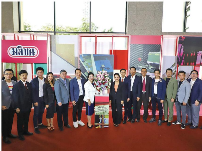
คุณหญิงสุดารัตน์ เกยุราพันธุ์ หัวหน้าพรรคไทยสร้างไทย พร้อมคณะผู้บริหารพรรค ร่วมยินดี