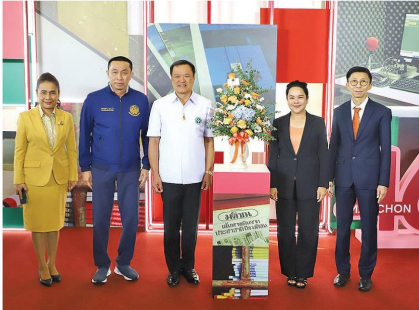
อนุทิน ชาญวีรกูล รองนายกรัฐมนตรี และ รมว.สาธารณสุข หัวหน้าพรรคภูมิใจไทย (ภท.) ศักดิ์สยาม ชิดชอบ รมว.คมนาคม และเลขาธิการพรรค ภท. กนกวรรณ วิลาวัลย์ รมช.ศึกษาธิการ ร่วมอวยพร

หัวข้อข่าว: 'มติชน' ก้าวสู่ปีที่ 46 อุ่นใจ อวยพรแน่นชงถูกต้องรวดเร็ว