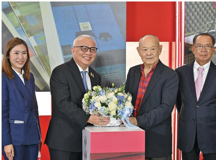
สุพัฒน์พงษ์ พันธุ์เชาว์ รองนายกฯ และ รมว.พลังงาน ร่วมแสดงความยินดี