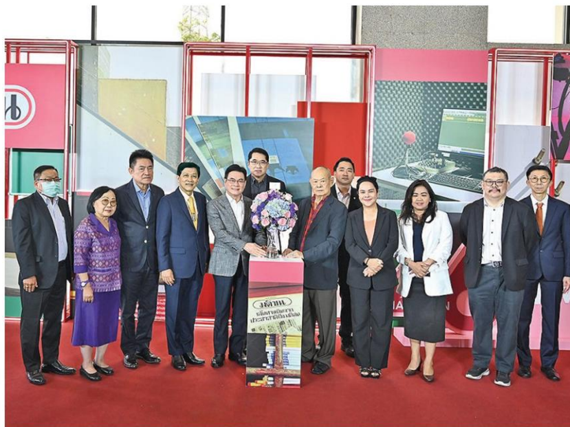
จรินทร์ ลักษณวิศิษฏ์ รองนายกรัฐมนตรี และ รวม.พาณิชย์ หัวหน้าพรรคประชาธิปัตย์ นำคณะผู้บริหารพรรค ร่วมแสดงความยินดี มติชนก้าวสู่ปีที่ 46