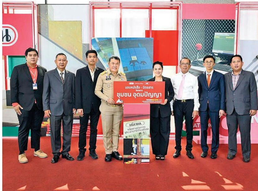
สุทธิพงษ์ จุลเจริญ ปลัดกระทรวงมหาดไทย ร่วมแสดงความยินดี

หัวข้อข่าว: 'มติชน' ก้าวสู่ปีที่ 46 อุ่นใจ อวยพรแน่นชูถูกต้องรวดเร็ว