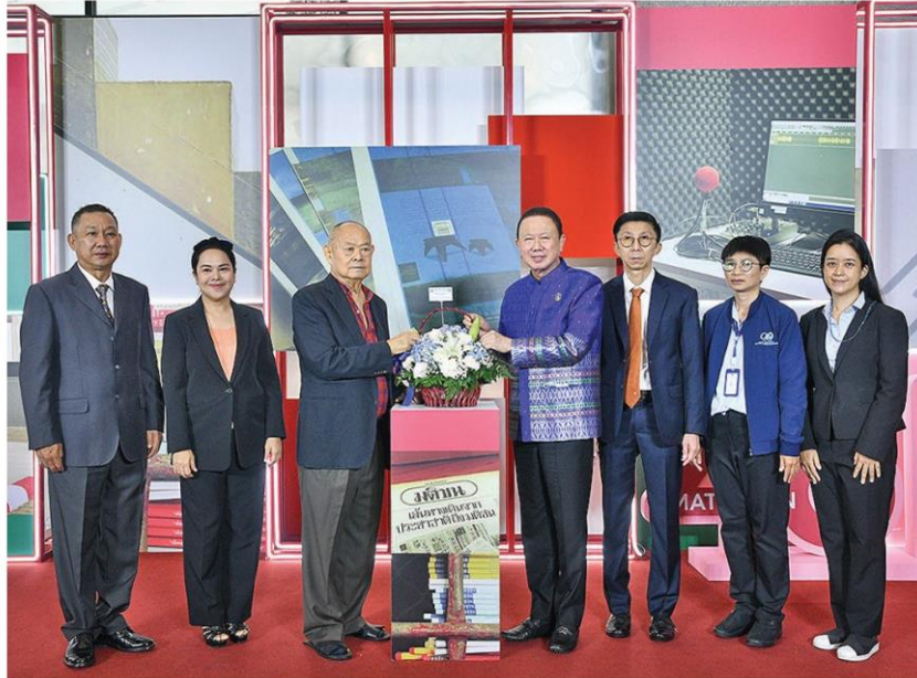
สนัน อังอุบลกุล ประธานสภาหอการค้าแห่งประเทศไทย ร่วมแสดงความยินดี

หัวข้อข่าว: 'มติชน' ก้าวสู่ปีที่ 46 อุ่นใจ พรแห่งชูถูกต้องรวดเร็ว