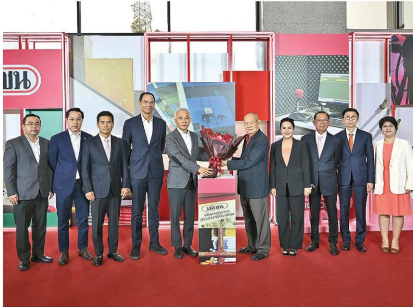
สุวัจน์ ลิปตพัลลภ ประธานพรรคชาติพัฒนา กล่าว กรณ์ จาติกวณิช หัวหน้าพรรค พร้อมคณะผู้บริหารพรรค ร่วมแสดงความยินดี

หัวข้อข่าว: 'มติชน'ก้าวสู่ปีที่46อบอุ่น อวยพรแน่นชูถูกต้องรวดเร็ว