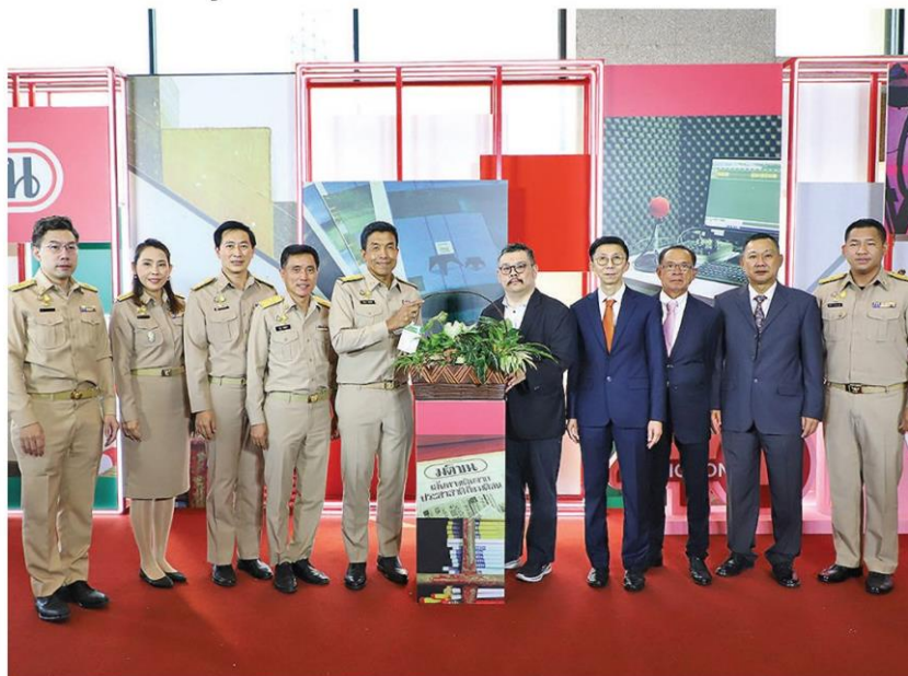
ชัชชาติ สิทธิพันธุ์ ผู้ว่าราชการกรุงเทพมหานคร พร้อมคณะผู้บริหาร ร่วมแสดงความยินดี