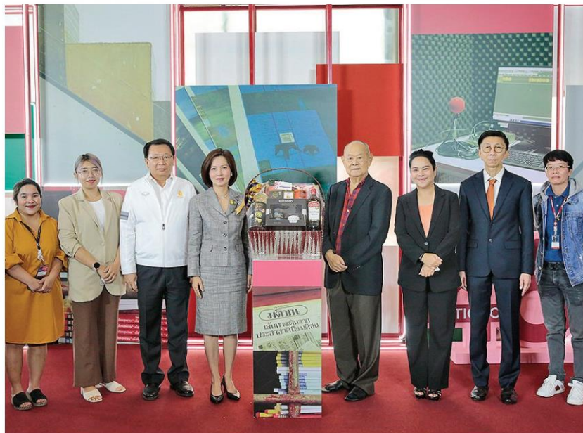
ตรีนุช เทียนทอง รัฐมนตรีว่าการกระทรวงศึกษาธิการ นำคณะผู้บริหาร ร่วมแสดงความยินดี