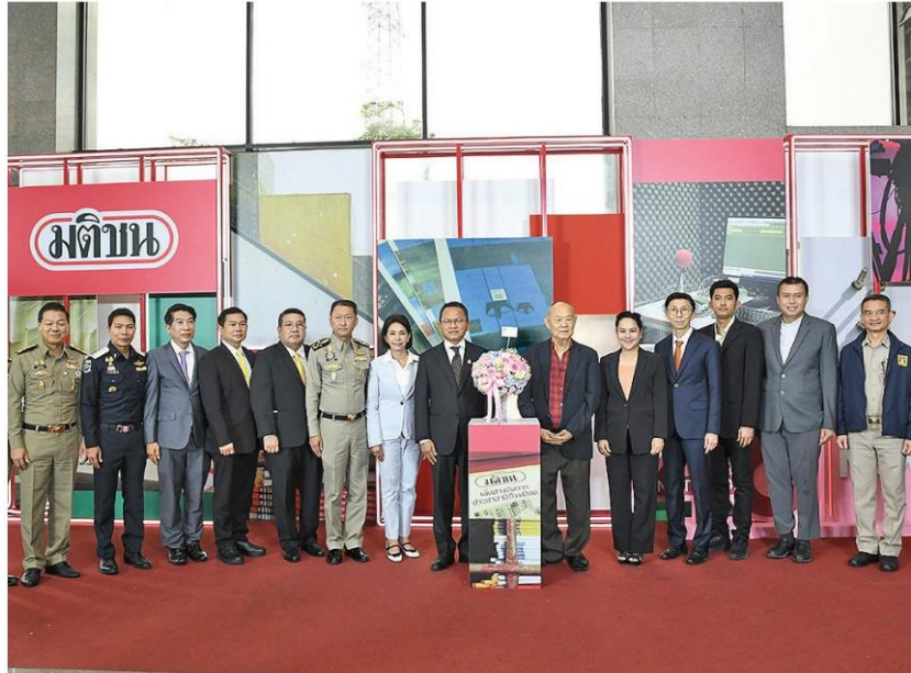
สมศักดิ์ เทพสุทิน รัฐมนตรีว่าการกระทรวงยุติธรรม พร้อมคณะผู้บริหารกระทรวงยุติธรรม ร่วมแสดงความยินดี

หัวข้อข่าว: 'มติชน' ก้าวสู่ปีที่ 46 อุ่นใจพร้อมชูถูกต้องรวดเร็ว