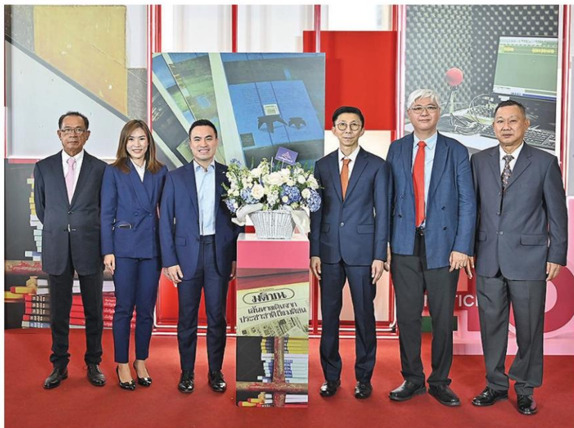
เอกนัฏ พร้อมพันธุ์ เลขาธิการพรรครวมไทยสร้างชาติ (รทสช.) ร่วมอวยพร