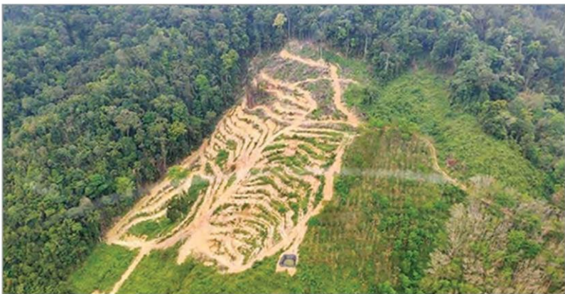
รูปป่า - สภาพพื้นที่บริเวณป่าสงวนแห่งชาติป่าเขาขาว รอยต่อระหว่าง อ.บางขัน และ อ.ทุ่งสง จ.นครศรีธรรมราช ซึ่งพบการแผ้วถางตัดโค่นไม้ขนาดใหญ่ และปรับพื้นที่ป่าเป็นขั้นบันไดเตรียมทำการเกษตรอย่างกว้างขวาง ขณะเฮลิคอปเตอร์ของกระทรวงทรัพยากรธรรมชาติและสิ่งแวดล้อม บินทดลองเครื่องระหว่างซ่อมบำรุง

ทั้งนี้ มีรายงานแจ้งด้วยว่า นอกเหนือจากการสำรวจของกระทรวงทรัพยากรฯ แล้ว ก่อนหน้านี้ก็ได้มีผู้ร้องเรียนว่า มีนายทุนใหญ่บุกรุกยึดพื้นที่กลางหุบเขา ป่าเขาขาว จ.นครศรีธรรมราช หลายร้อยไร่ จนภูเขาและป่าสงวนแห่งชาติที่เป็นป่าต้นน้ำที่อุดมสมบูรณ์กลายเป็นภูเขาหัวโล้น และมีการบุกรุกขยายพื้นที่ตัดโค่นต้นไม้ขนาดใหญ่ แผ้วถางพื้นที่ป่าจนเตียนโล่งเพิ่มมากขึ้นเรื่อยๆ