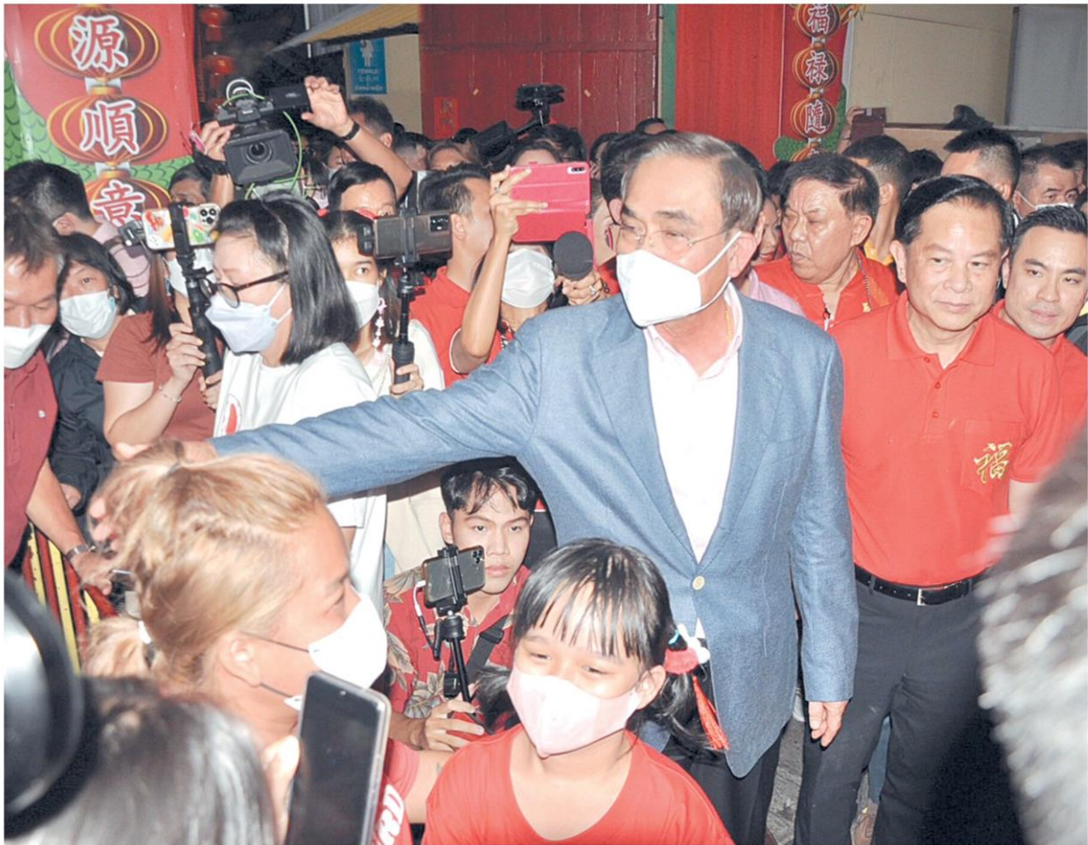
● ลงพื้นที่เยาวราช...พล.อ.ประยุทธ์ จันทร์โอชา นายกรัฐมนตรี และ รมว.กลาโหม ในฐานะสมาชิกพรรครวมไทยสร้างชาติ(รทสช.) พร้อมด้วย นายพีระพันธุ์ สาลีรัฐวิภาค เลขาธิการนายกรัฐมนตรี ในฐานะหัวหน้าพรรครวมไทยสร้างชาติ และแกนนำพรรค นำสมาชิกพรรค และว่าที่ผู้สมัครส.ส.กทม. ลงพื้นที่พบประชาชน ไหว้สิ่งศักดิ์สิทธิ์ขอพร ที่วัดมังกรกมลาวาส (วัดเล่งเน่ยยี่) เยาวราช

หัวข้อข่าว: บิ๊กป้อม-รทสช.บุกเยาวราช พปชร.เสริมทัพลุยศึกเลือกตั้ง