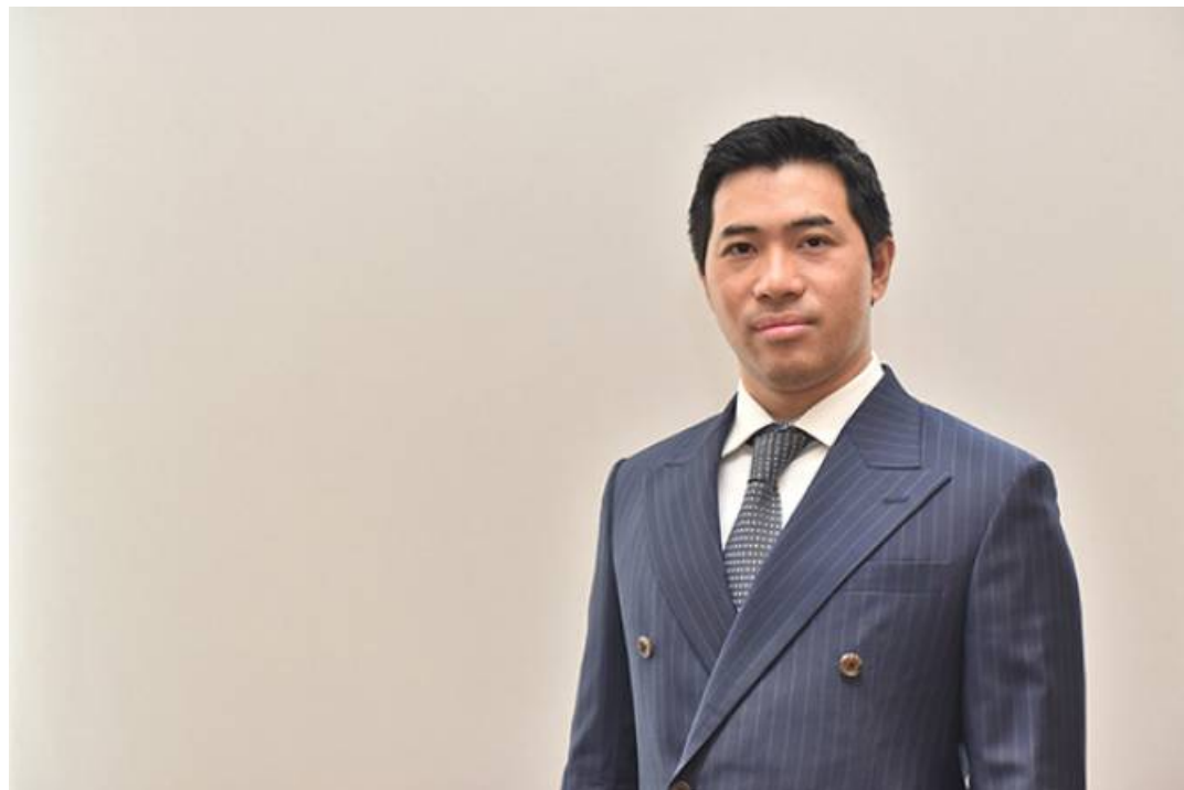
'STA' ปลื้มทริสเรทตั้งคองอันดับเครดิตองค์กรปี 66 ที่ระดับ 'A' แนวโน้ม 'Stable'

ติดตาม 1.6 แสน คนกำลังติดตามสิ่งนี้ เป็นคนแรกในหมู่เพื่อนของคุณที่ติดตามสิ่งนี้