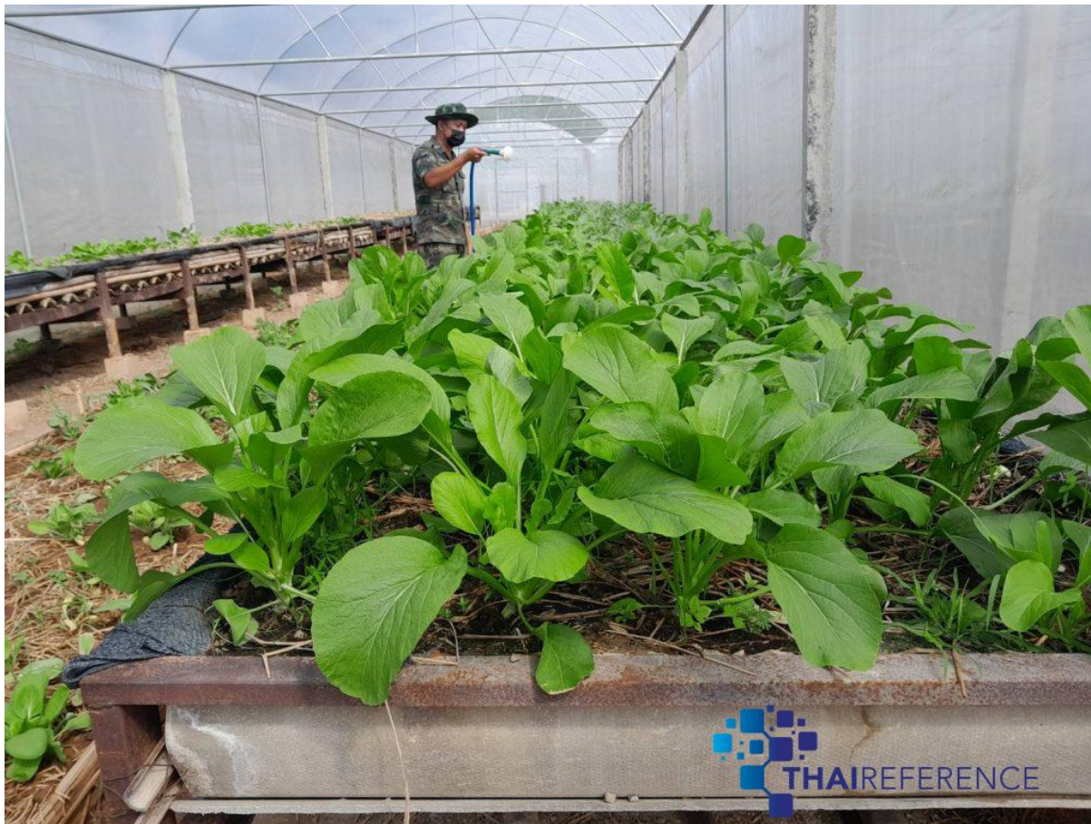
ในลักษณะการเรียนรู้จากการทำจริงแบบ Learning by doing ตามหลักปรัชญาเศรษฐกิจพอเพียง เพื่อให้เกษตรกรชาวสวนยางได้เรียนรู้ แลกเปลี่ยนประสบการณ์รวมถึงหาแนวทางในการพัฒนาอาชีพ และทางเลือกในการประกอบอาชีพเสริม นอกจากนี้การทำสวนยางพารา ณ โครงการทหารพันธุ์ดีน่าน ฐานปฏิบัติการแสงเพ็ญ ตำบลฝายแก้ว อำเภอภูเพียง จังหวัดน่าน