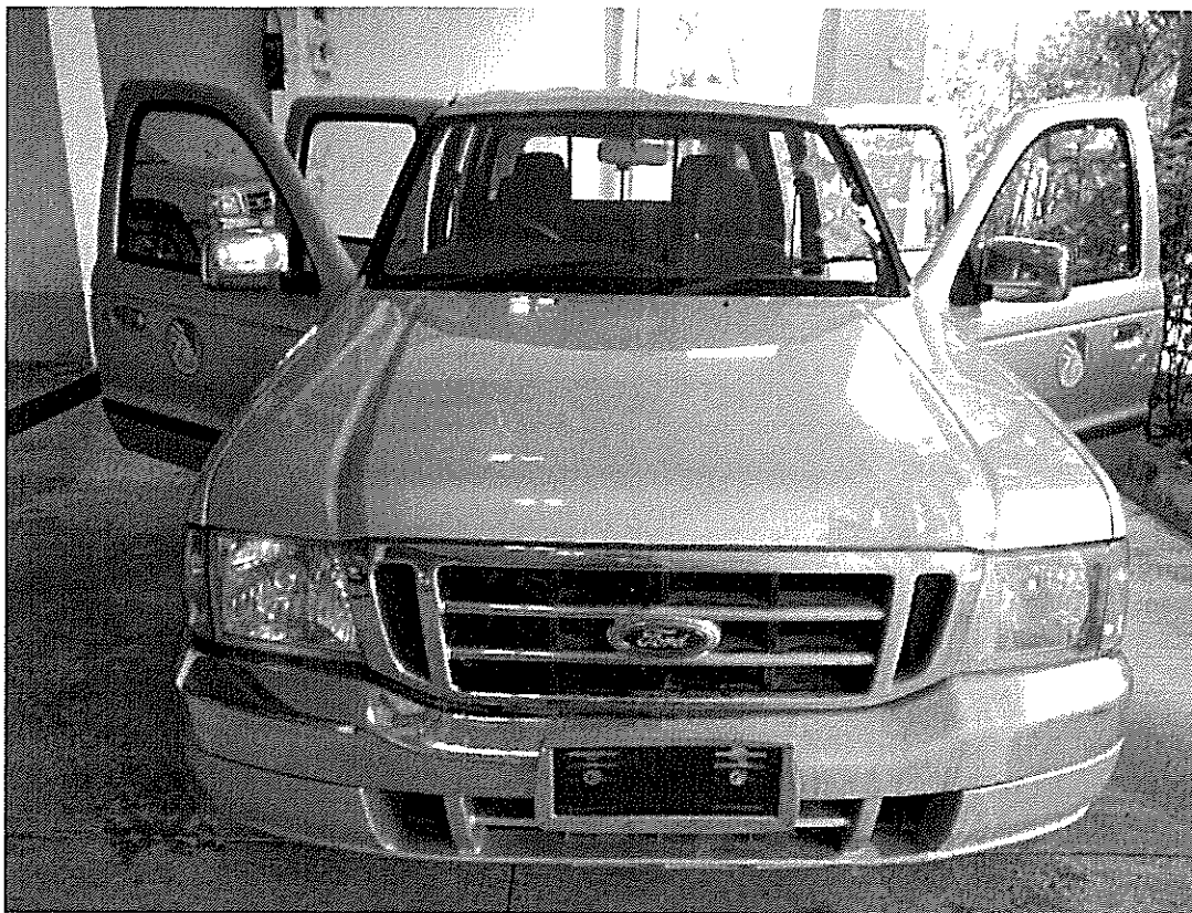
ภาพประกอบการขายทอดตลาด รถยนต์ส่วนกลาง หมายเลขทะเบียน ฮก ๔๓๘๔ กทม. การยางแห่งประเทศไทยจังหวัดเชียงใหม่