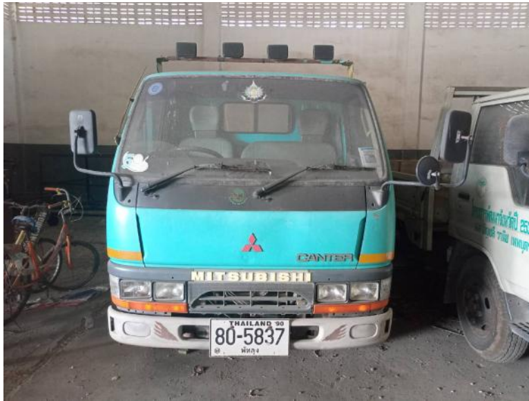
มิตซูบิชิแคนเตอร์ 3000CC (80-5837 พัทลุง)