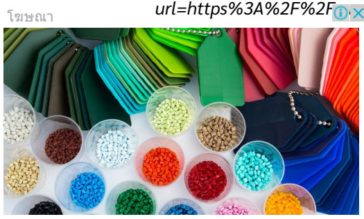
KPAC โรงงานผลิตบรรจุภัณฑ์ - ผ่านการรับรอง GMP และ HACCP kpacindustry.co.th เข้าชม