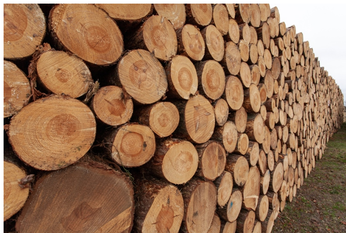
( https://www.thailandplus.tv/archives/743196/selection-of-wooden-stumps-in-the-countryside-2 )

อธิบดีกรมการค้าต่างประเทศ กล่าวเพิ่มเติมว่า กรณีที่ผู้ประกอบการเสนอขอให้การส่งออกสิ่งประดิษฐ์ไม้อัดพาร์ติเคิลบอร์ด ไม้ โตเร็ว ได้รับการยกเว้นเช่นเดียวกับไม้ยางพาราหรือสิ่งประดิษฐ์ที่ทำจากไม้ยางพารา ภาคเอกชนอาจพิจารณาจัดทำข้อมูล เสนอคณะกรรมการนโยบายป่าไม้แห่งชาติขอปรับแก้ไขเงื่อนไขการส่งออกไม้และผลิตภัณฑ์เพื่อเป็นการแก้ไขปัญหาในระยะ ยาวต่อไป ทั้งนี้ ผู้ประกอบการที่ประสงค์จะขอเอกสารใบอนุญาตส่งออกหรือหนังสือรับรองฯ สามารถติดต่อสอบถามขั้นตอน และรายละเอียดเพิ่มเติมได้ที่สำนักเศรษฐกิจการป่าไม้ กรมป่าไม้ โทร. 02-561-4292 ต่อ 5679 และกรณีที่มีข้อสงสัยเกี่ยวกับ ข้อกำหนดของประกาศกระทรวงพาณิชย์ สามารถสอบถามรายละเอียดได้ที่ DFT Call Center โทร 1385 หรือกองบริหาร การค้าสินค้าทั่วไป กรมการค้าต่างประเทศ โทร. 02-547-5120