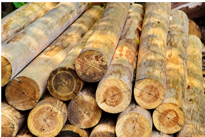
( https://www.thailandplus.tv/archives/743196/pile-logs-2 )

THAILAND PLUS TV Documentar MENU ให้กับไม้ต่างประเภทไม้ประจำถิ่นหรือไม้ที่ปลูกในป่า (ซึ่งควรเพิ่มผู้ที่เกี่ยวข้อง) จสอบในพื้นที่ได้นอกเหนือจากเจ้าหน้าที่กรมป่าไม้ที่ดูแลพื้นที่เขต เท่านั้น รวมทั้งขอหมายให้กรมศุลกากรพิจารณาแทรกหัสสถิติสินค้าสิ่งประดิษฐ์ที่ทำจากไม้ยางพาราเป็นการเฉพาะ อย่างไรก็ดี หากกรมป่าไม้หรือกรมศุลกากรมีแนวทางแก้ไขอื่นๆ ขอให้หน่วยงานพิจารณาให้ความช่วยเหลือ ภายใต้กรอบ กฎหมายของหน่วยงานที่กำหนดต่อไปด้วย เพื่อลดอุปสรรคทางการค้าให้กับผู้ส่งออก และแก้ปัญหาที่เกิดขึ้นอย่างเป็นรูป ธรรม ทั้งนี้ กรมการค้าต่างประเทศจะติดตามการแก้ไขปัญหาดังกล่าวจากหน่วยงานที่เกี่ยวข้องอย่างใกล้ชิดต่อไป