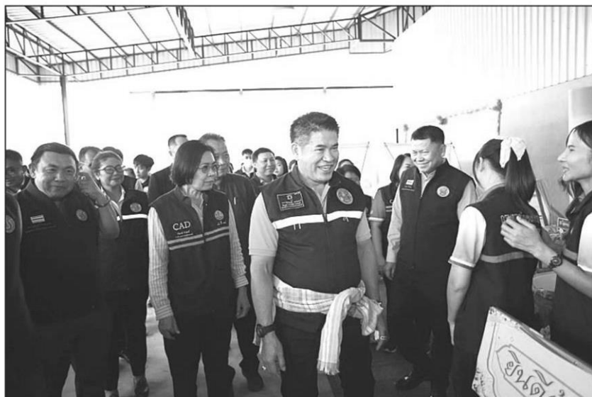
รับฟัง : ร.อ.ธรรมนัส พรหมเผ่า รมว.เกษตรและสหกรณ์ รับฟังและแก้ไขปัญหาเกษตรกรชาวสวนยาง พร้อมกับเยี่ยมชมโรงงานแปรรูปฯ ในพื้นที่ ต.ท่าสะอาด อ.เซกา จ.บึงกาฬ โดยจัดตั้งสหกรณ์ฯ พร้อมให้การยางแห่งประเทศไทย สนับสนุนเครื่องมือเครื่องจักรเพื่อแปรรูปยางพารามีคุณภาพ เพิ่มมูลค่าผลิตภัณฑ์ยางพารา

“การลงพื้นที่ครั้งนี้ ต้องการมาบอกข่าวดีกับพี่น้องชาวบึงกาฬ ไม่เพียงแต่ในเรื่องการเปลี่ยน ส.ป.ก. 4-01 เป็นโฉนดที่ดินเพื่อการเกษตรแล้ว ยังเตรียมดำเนินการเรื่องการออกโฉนดดินยางด้วย ซึ่งต้นยางหนึ่งต้น จะมีมูลค่าไม่ต่ำกว่า 500 บาท ถือเป็นการเพิ่มมูลค่าทรัพย์สินในต้นยาง เกษตรกรสามารถนำโฉนดต้นยางไปกู้และต่อทุน ถือเป็นการแปลงสินทรัพย์เป็นทุนเพื่อต่อยอดการดำเนินการต่อไป” ร.อ.ธรรมนัส กล่าว