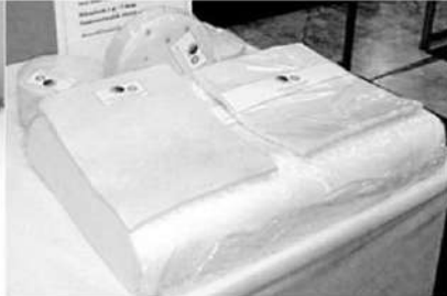
* ยางรองคองคาน