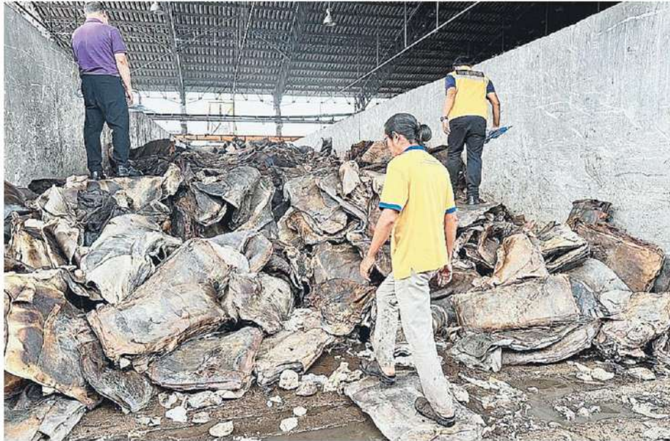
อายัดยาง จนท.การยางฯ จ.กระบี่ ร่วมกับตำรวจ ตรวจสอบโรงงานยาง บ.ไทยแมคเคสทีอาร์ ส.เมทลา อ.คลองท่อม จ.กระบี่ พบยางแผ่นดิบน้ำหนักรวม 245,421 กก. มูลค่ากว่า 18 ล้านบาท สั่งอายัดไว้ตรวจสอบหาแหล่งที่มาให้แน่ชัด.