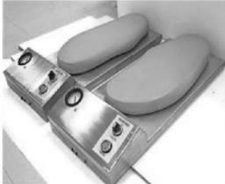
ตัวอย่างผลิตภัณฑ์ยาง