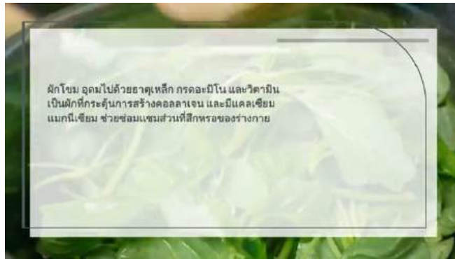
Powered by GliaStudio