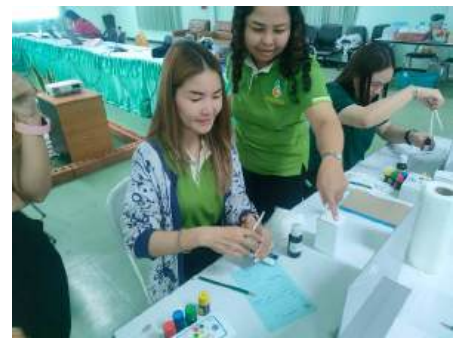
(https://www.thailandplus.tv/archives/851599/395377_0) (https://www.thailandplus.tv/archives/851599/395380_0) (https://www.thailandplus.tv/archives/851599/395382_0) 2)

นางสาวปริญญพร กล่าวว่า การยางแห่งประเทศไทย กำลังศึกษาแนวทางในการจัดตั้งห้องปฏิบัติการตรวจวิเคราะห์ค่าความเข้มข้นด้วยการดม (Sensory test) ซึ่ง คพ.ได้ส่งเจ้าหน้าที่เข้าไปอบรมและฝึกปฏิบัติเกี่ยวกับการเก็บตัวอย่างและการตรวจวัดค่าความเข้มข้นจากโรงงานผลิตยาง ให้กับพนักงานลูกจ้างและเจ้าหน้าที่ของการยางแห่งประเทศไทย ทั้งนี้ ห้องปฏิบัติการวิเคราะห์กลิ่นด้วยการดมแห่งนี้ จะให้บริการตรวจวัดค่าความเข้มข้นให้แก่ผู้ประกอบการยางและสถาบันเกษตรกรผู้ผลิตยางแก่