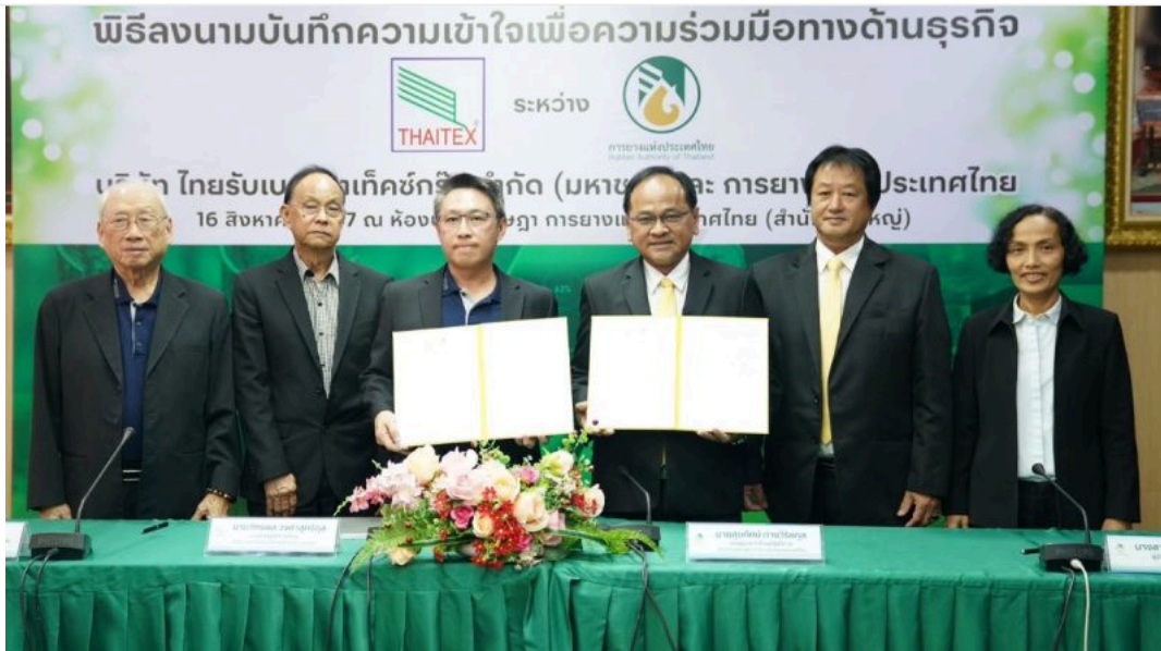
ข่าวประชาสัมพันธ์