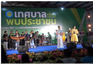
เปิดงานเทศกาลนครสงขลาพประชาชนปี2567