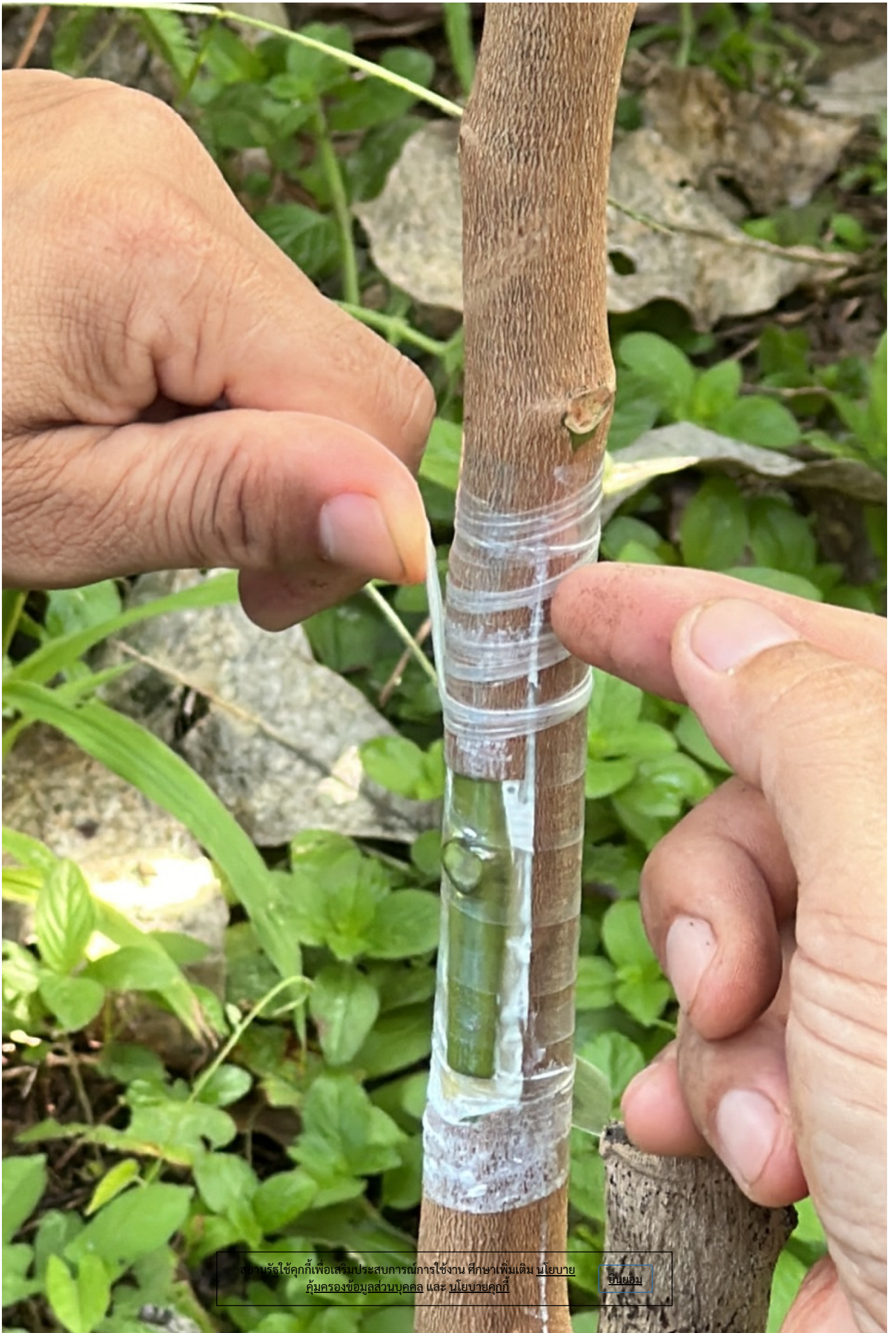
สถาบันวิจัยสุพรรณบุรีเพื่อเสริมประสิทธิภาพการใช้งาน ศึกษาเพิ่มเติม นโยบาย คุ้มครองข้อมูลส่วนบุคคล และ นโยบายคุกกี้