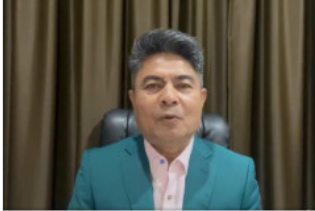
"เทพไท" ถามคนสงขลาแล้ว! ไม่เห็นด้วย "ปชป." ร่วมรัฐบาล