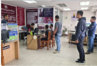
สองโจรคู่หูปั่นกำแพงจรัณโก่ทอดตั้ง ตำรวจตามรวบได้ทันที่คาร์เตอร์

คณะเทคโนโลยีการเกษตรการเกษตร มรภ.สงขลา นำนักศึกษาสาขาวิชาเทคโนโลยีการผลิตพืช เรียนรู้พร้อมฝึกทักษะปฏิบัติการ ณ ศูนย์ควบคุมยางสงขลา บูรณาการการเรียนรู้รายวิชาพีชเศรษฐกิจภาคใต้ หวังช่วยให้สามารถปฏิบัติการในแปลงอย่างถูกต้อง นำไปสู่การได้น้ำยางพาราที่มีคุณภาพ เพิ่มรายได้แก่เกษตรกรในท้องถิ่น