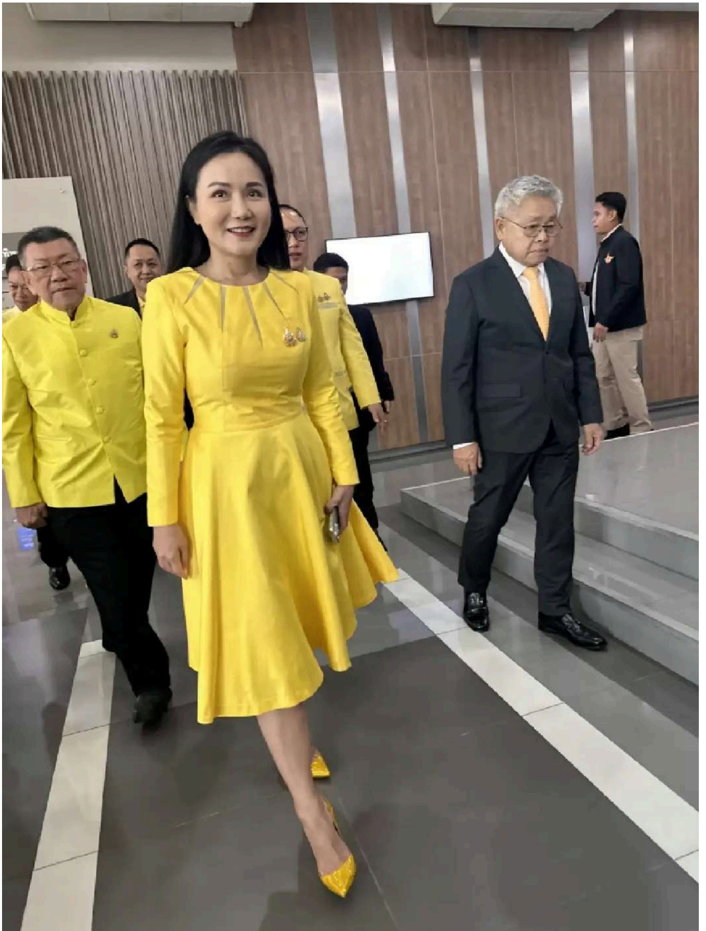
นฤมล ภิญโญสินวัฒน์ รมว.เกษตรและสหกรณ์