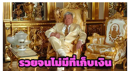
รวยจนไม่มีที่เก็บเงิน

นักอุดมความเข้มตัว คัมภีร์ใจล้ค้าคอง... ชื่อล้คองราคาพุ่ง... หนเียเรลงเลขสวย